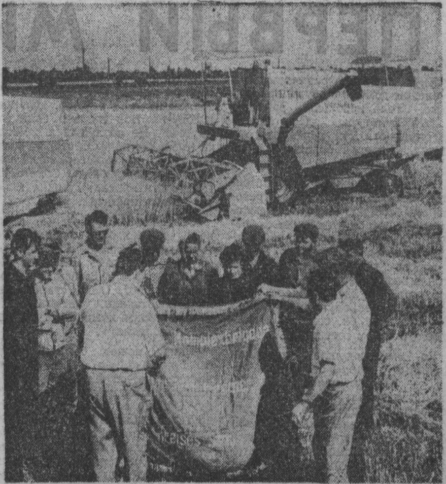
ГЕРМАНСКАЯ ДЕМОКРАТИЧЕСКАЯ РЕСПУБЛИКА. Большую роль в успешной уборке урожая зерновых играет в этом году новая сельскохозяйственная техника...