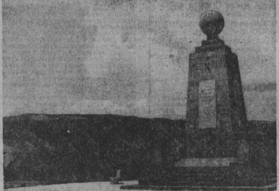
НА СИМВЛЕ: «Там, где мир делится пополам». Монумент установлен на линии экватора.

Эквадор — одна из немногих южноамериканских стран, чью территорию пересечает экватор. Это название бывшая испанская колония получила в 1830 году, когда стала независимой. Итальянцы Эквадора еще в давние времена отметили интересное явление: солнце над ними дважды в год перемещается с одной стороны на другую, и ни люди, ни предметы не отбрасывают в полдень никакой тени. Солнце стоит прямо над головой.