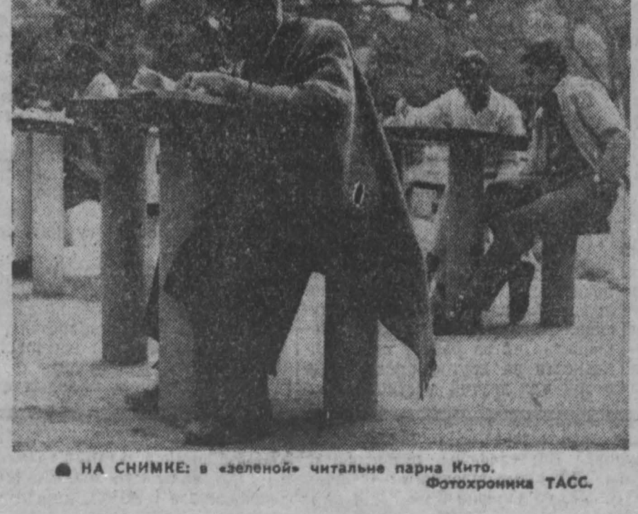
НА СИМВЛЕ: в «зеленой» цитальне парка Кито.