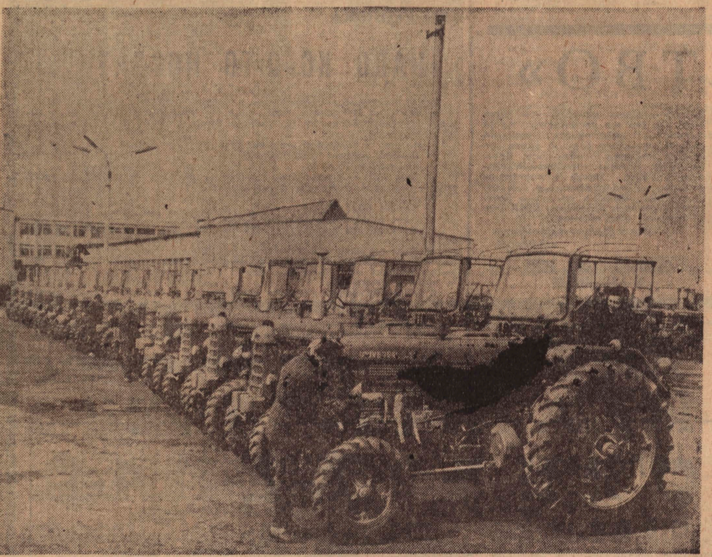
С каждым годом растет производство колесных и гусеничных тракторов на Братском заводе в Гумбинне. На снимке: тракторы У-651 готовы к отправке.

«Сонная болезнь» свирепствует уже в 20 из 46 префектур страны. По данным министерства, энцефалит в нынешнем году привлек уже к 75 смертным случаям. В больницах в настоящее время находится 243 человека, болящих этой опасной болезнью.