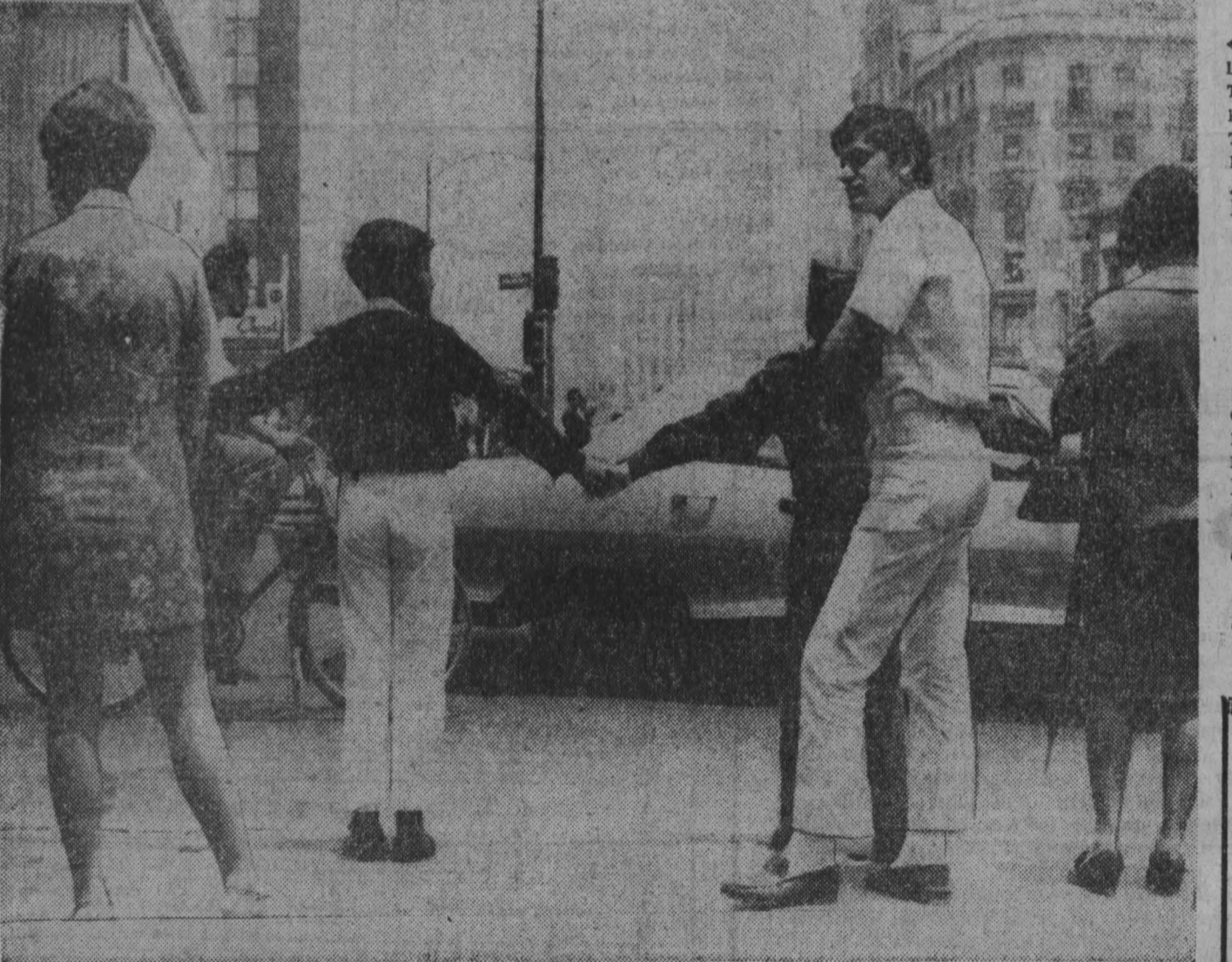
МЕКСИКА. Готовясь к XIX летним Олимпийским играм, город Мехико пытается решить не только транспортную проблему, неизбежную для бмиллионного города, но и пешеходную... Дело в том, что мексиканские «летописцы», как и пешеходы во многих других странах, не очень терпеливы и не хотят пересечь улицу, прорытую перед нависающей машиной. Результаты подобного далекого не олимпийского соперничества подчас трагичны, поэтому городские власти столицы Мексики предприняли еще одну попытку улучшить пешеходов. На улицы вышли ученики начальных классов. Как настоящие регулировщики движения, они получили свисток, форму с лентой на груди, на которой написано «дорожное образование». На свисток всегда зажигается красный свет, ребята берутся за руки и останавливают взрослых терпеливо пропускать проходящий транспорт, дожидаясь зеленого сигнала светофора. Результаты этой кампании пока еще не известны.

квартиры города, побили стекла в принадлежащих арабам магазинах и машинах. Несколько арабов получили увечья. По улицам патрулируют усиленные полицейские наряды. Впервые вместе с гражданской и пограничной полицией в патрулировании участвуют солдаты израильской армии. Ко всеобщей забастовке призвала организация «Арабский национальный комитет».