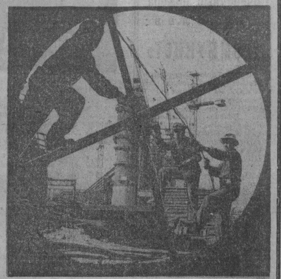
● НИЖНИЙ ТАГИЛ. До пуска крупнейшей в Европе доменной печи объемом 2.700 кубов осталось менее полугода. Тагильчане с каждым днем наращивают темпы работы, борясь за досрочное введение в строй домы-гиганта. Коллектив строителей доменной печи № 6 ежедневно выполняет задание на 140 процентов.