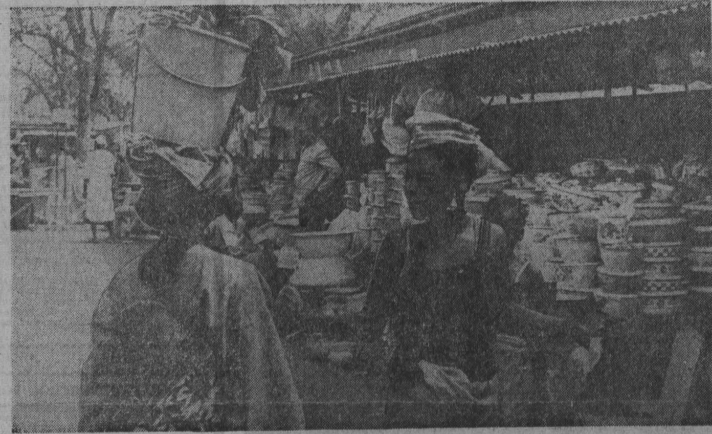
УАГАДУГУ (Республика Верхняя Вольты). Столичный базар — это не только место, где можно купить и продать; сюда съезжаются все, у кого есть время, чтобы обсудить последние новости.

ПАРИЖ, 19 августа. (ТАСС). Южновьетнамские патриоты продолжают наступательные действия против американской армии и сайгонских войск. Как сообщает сайгонский корреспондент агентства Франс Пресс, вчера бои происходили в пригородах и центре города Тайнин, расположенном в 90 километрах от Сайгона. Сегодня утром южновьетнамские партизаны подвергли артиллерийскому обстрелу и атаковали лагерь «специальных» войск США в Лонкине. Бои ведутся также в ряде районов провинции Диньхонг, примерно в 60 километрах от южновьетнамской столицы (дельта реки Меконг). По сообщениям представителя американского командования, потери войск США составили около 200 человек убитыми и ранеными. Сильному обстрелу подверглись также оборонительные сооружения в шести километрах к юго-востоку от Сайгона и позиции подразделений армии США в 40 километрах к западу от района Сайгон-Шолон. Десант 9-й пехотной дивизии США на реке Меконг (провинция Диньхонг) попал под огонь южновьетнамских партизан. В ходе завязавшейся бои, который продолжался пять часов, американцы потеряли убитыми и ранеными большое число солдат и офицеров. В ходе боя был сбит один американский вертолет.