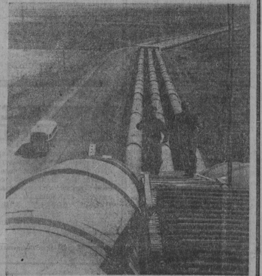
● ЕРЕВАН. Коллектив четвертого строительного треста «Армводстрой» и Разданского специального управления треста «Армпроммонтаж» закончили за два года ринные сроки монтажные работы по вводу в действие крупнейшей в республике Мачанской насосной станции, которая позволит сэкономить 130 миллионов кубометров ереванской воды, оросить тысячи гектаров земель Араратской долины. Живительная вода пошла на поля.