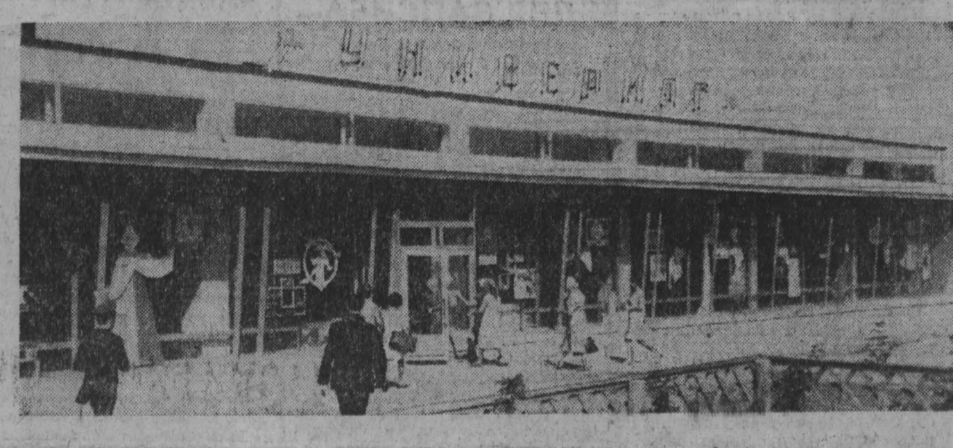
На снимке вы видите современный агрегат, открытый в Тисуле. Он со своим оформлением, во всем отблеске — свободный доступ к товарам.

Усовершенствован ряд узлов и деталей кузнечно-штамповочного пресса «6300» с маркировкой Новокузнецкого машиностроительного завода. Этот агрегат сможет обрабатывать в час 350 повок любой конфигурации — значительно больше, чем выпускные прессы.