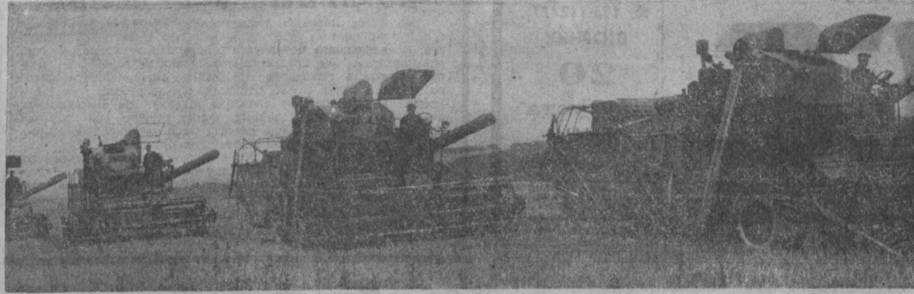
На полях Ленинск-Кузнецкого района началась массовая уборка зерновых. Двумя полетами комбайны ячменя совхоза «Демьяновский». Только во втором отделении трудятся десятки степенных комбайнеров. НА СНИМКЕ: уборка ячменя в совхозе.