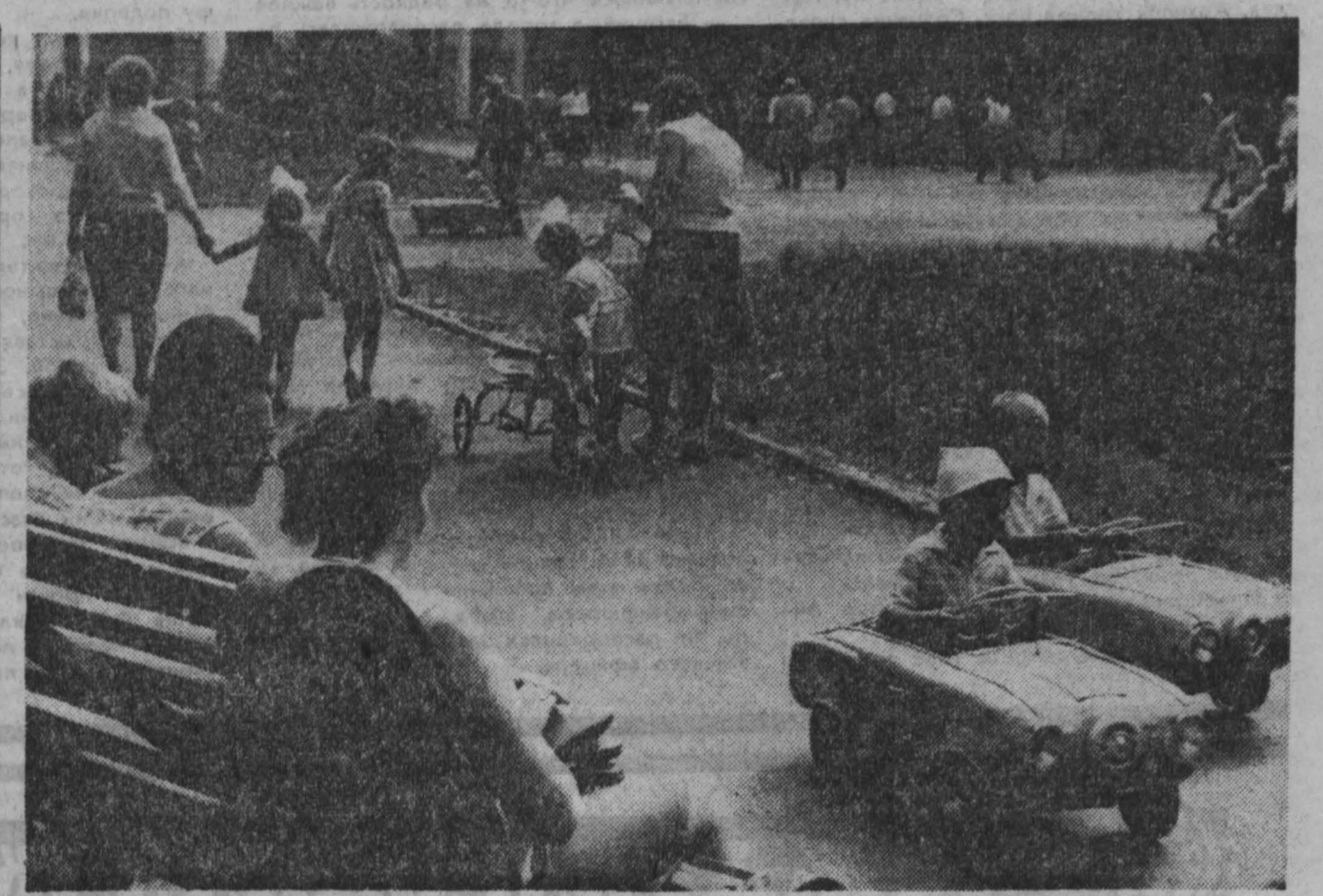
В ПАРКЕ.