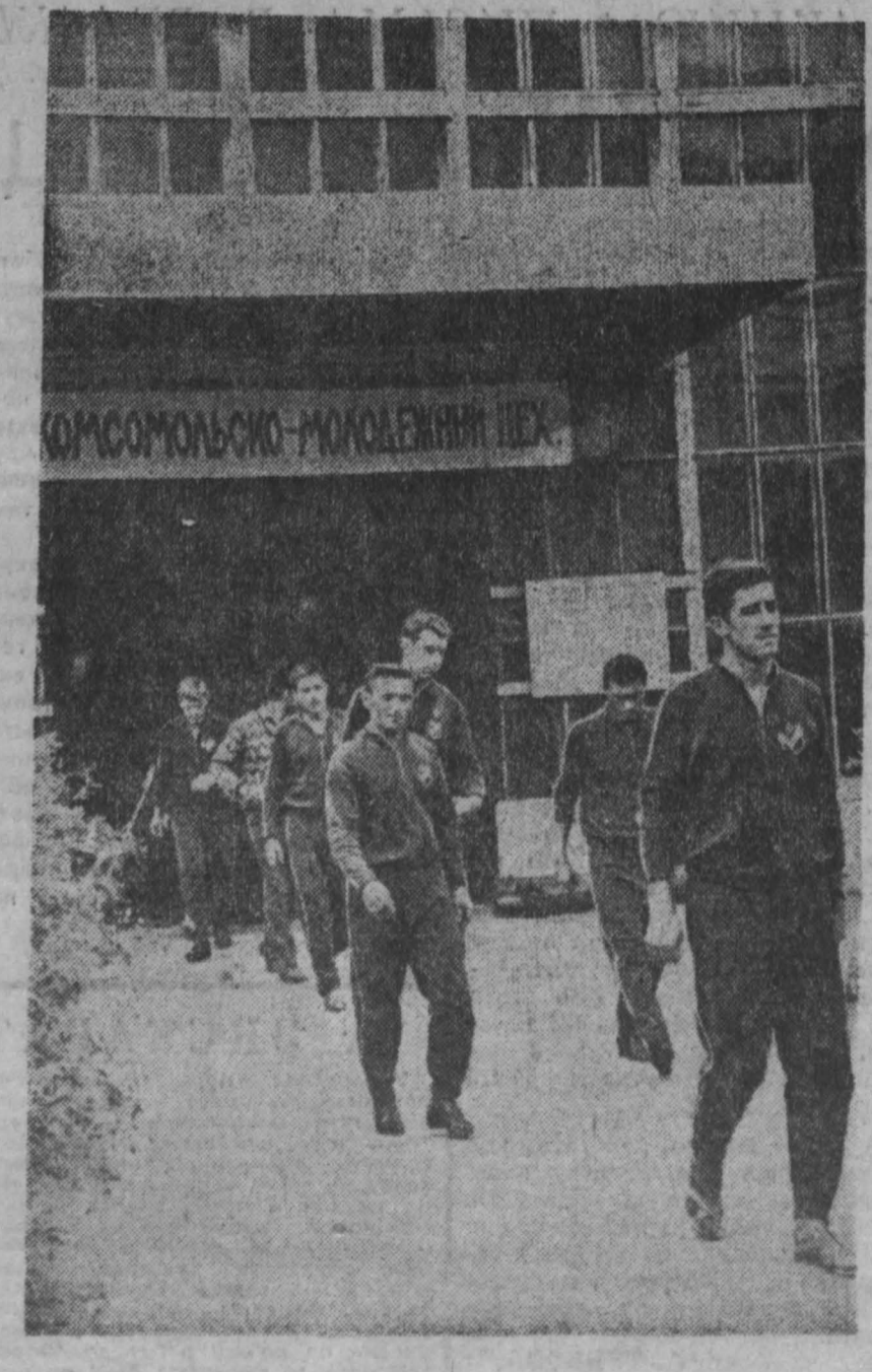
НА СНИМКЕ: венгерские гости на Ново-Кемеровском химвкомбинате.

— Радаемся большим дружеским отношениям. Нам хочется поздравить лучших трудовых успехов рабочим