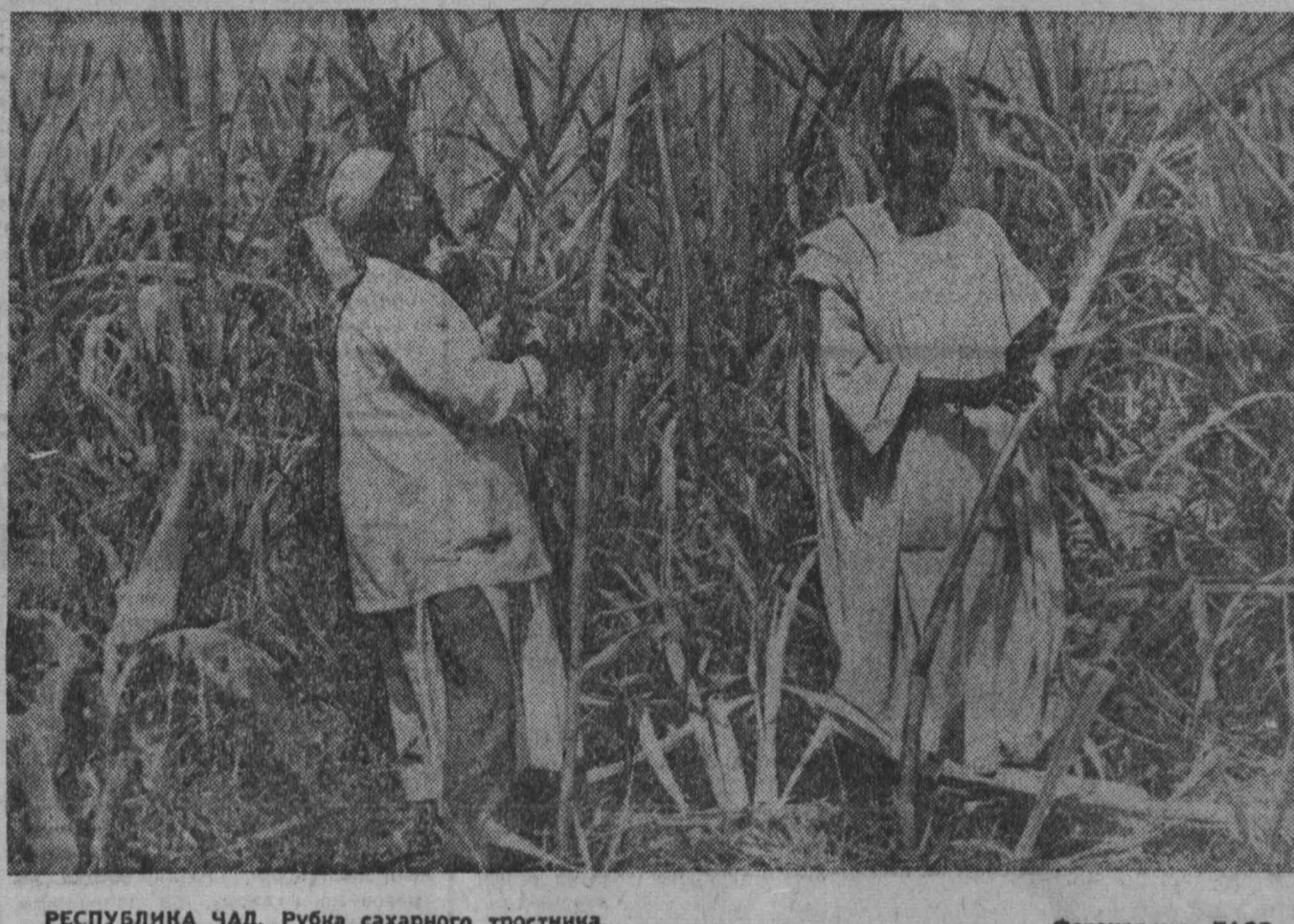
РЕСПУБЛИКА ЧАД. Рубка сахарного тростника.

ТОКИО, 1 июля. (ТАСС). Сильное землетрясение затрясло многих жителей японской столицы поинуть свои дома. Сейсмографы зарегистрировали подземный толчок силой в 4 балла по сембальской шкале, принятой в Японии. Об ущербе в результате землетрясения не сообщается.