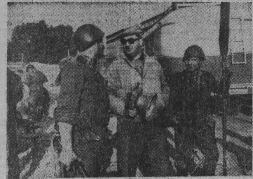
БЕРЛИН. В столице ГДР проходит съёмка фильма «Освобождение Европы».

НА СНИМКЕ: режиссер фильма Ю. Н. Озеров (в центре) с участниками съёмки фильма.