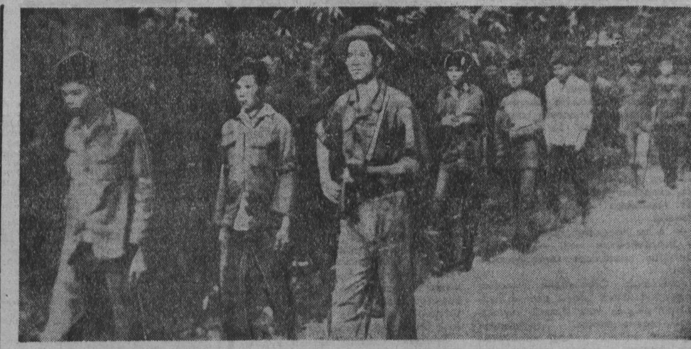
В Южном Вьетнаме повсеместно продолжаются ожесточенные бои между частями Народных вооруженных сил освобождения и американско-сайгонскими войсками. Американские агрессоры и их сателлиты несут тяжелые потери.

Пленум избрал комиссию для подготовки чрезвычайного съезда КПС.