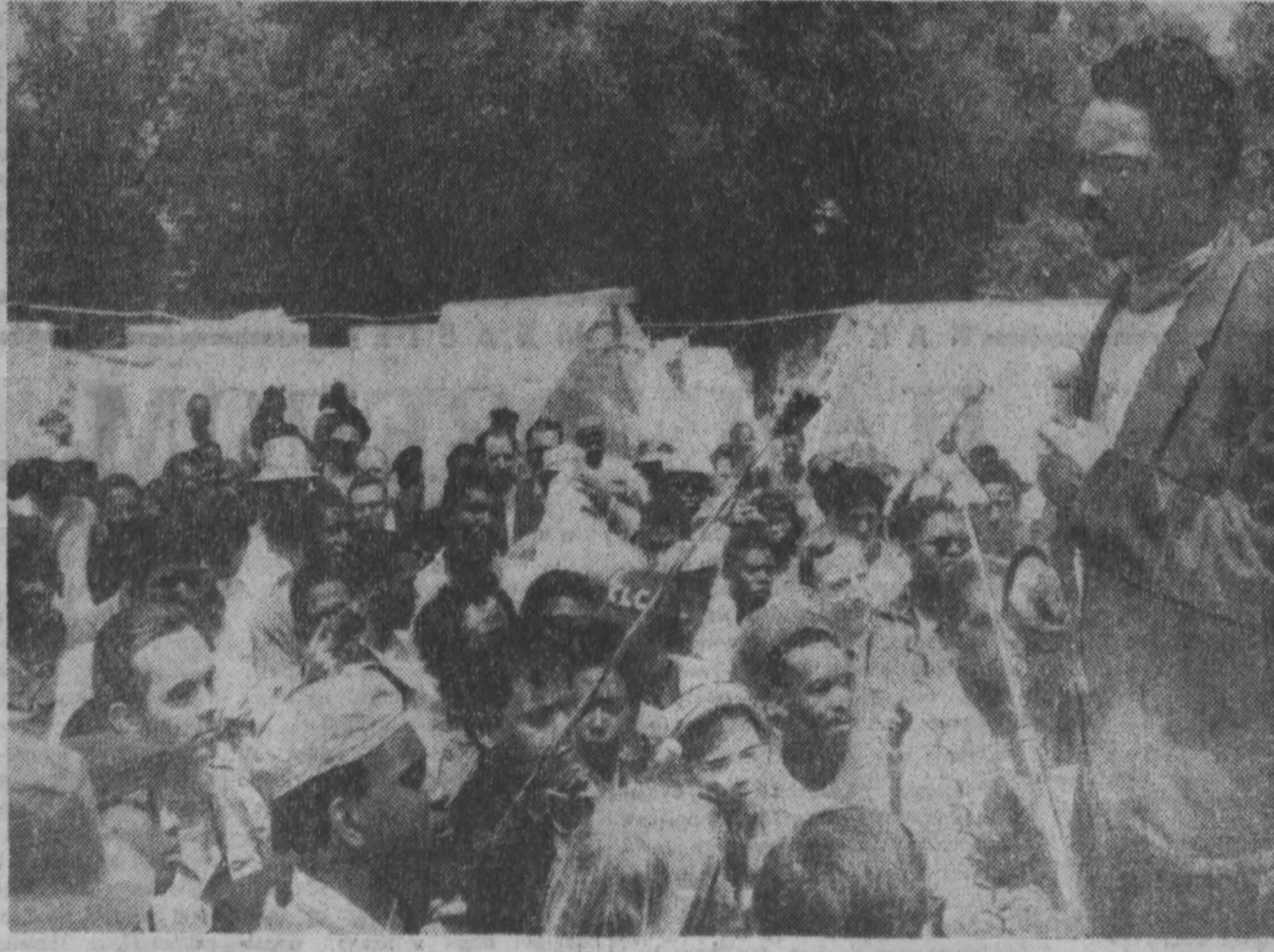
США. Жители «города воскресения», расположенного у подножия монумента Линкольна в Вашингтоне, продолжают кампанию в защиту прав афроамериканских бедняков. НА СНИМКЕ: на одном из митингов в палаточном городке. Выступает священник Джесси Дженсон — один из лидеров похода бедняков.

По согласованию между государствами-депонитариями Договора о нераспространении ядерного оружия, одобренного недавно Генеральной Ассамблеей ООН, договор будет одновременно открыт для подписания 1 июля 1968 года в трех столицах государств-депонитариев — Москве, Вашингтоне и Лондоне.