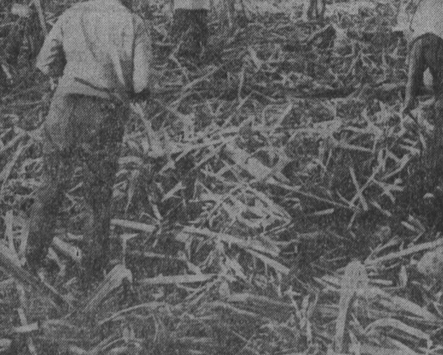
РЕСПУБЛИКА КУБА. Тысячи кубичек, молодых и старых, студенток и рабочих, жителей городов и поселков принимают участие в уборке и переработке сахарного тростника. Несмотря на сильную засуху, более 5 миллионов тонн сахара произведено в стране в ходе нынешней восьмой народной сбирки.