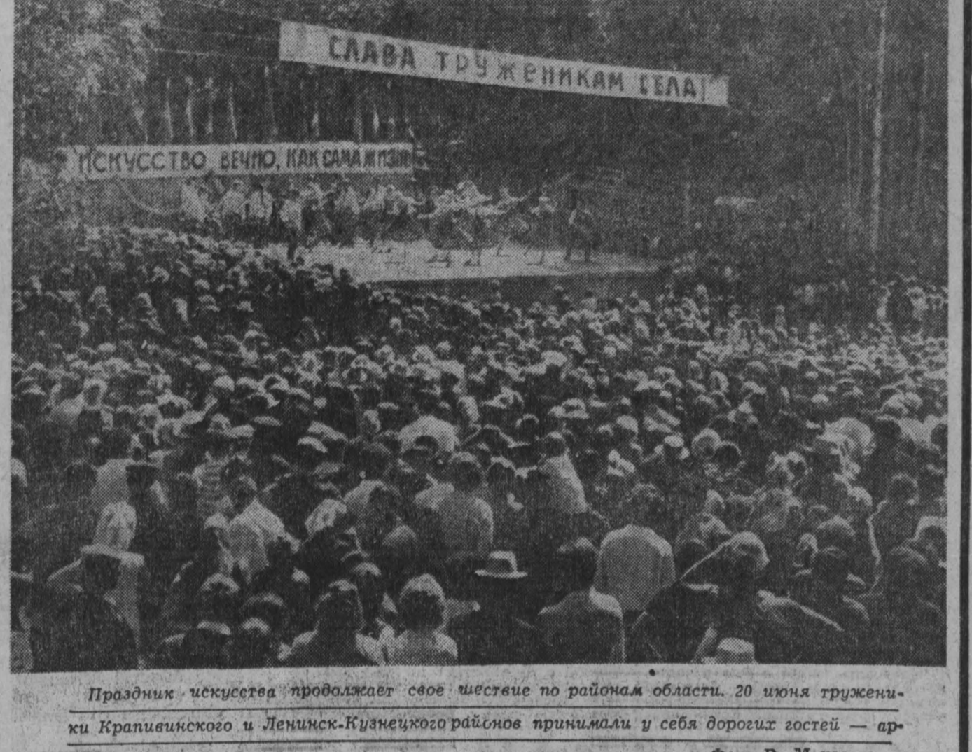
Праздник искусства продолжает свое шествие по районам области. 20 июня труженники Крапивинского и Ленинск-Кузнецкого районов принимали у себя дорогих гостей — артистов столицы.