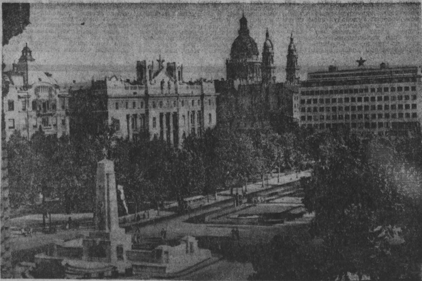
БУДАПЕШТ. Площадь Свободы.