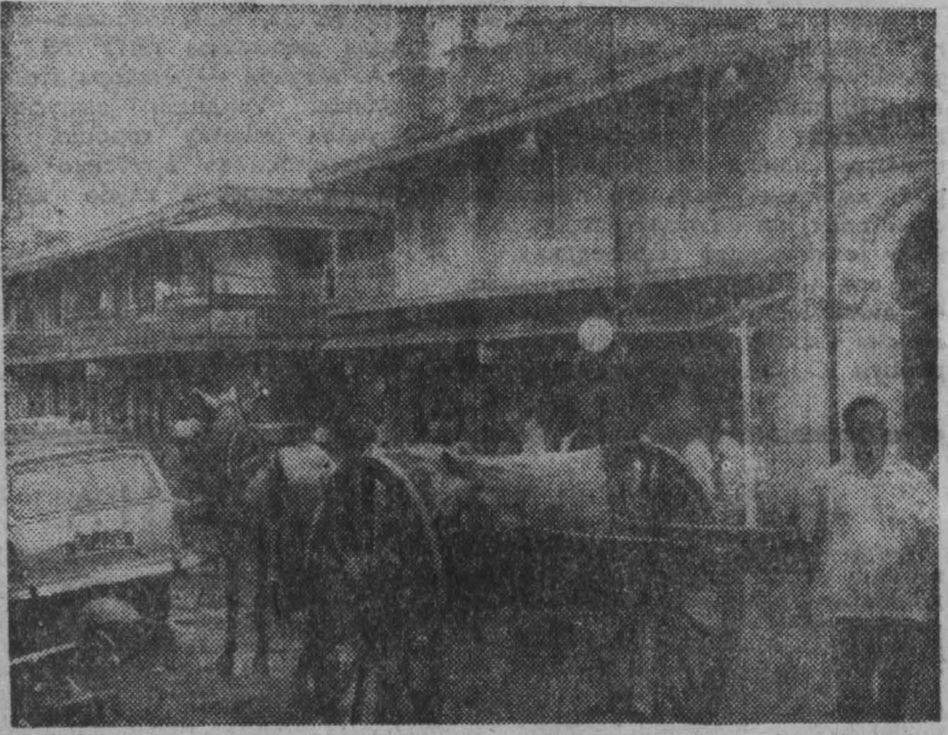
МАВРИКИЙ — самое молодое государство, расположенное в Индийском океане у восточного побережья Африки. 800-тысячное население страны отличается необычной пестротой. Здесь живут выходцы из Англии, Европы и Африки. Вот почему на улицах жилищ кварталов центральных городов будничные храмы соседствуют с мусульманскими мечетями, а лавки китайцев — с розничными французскими магазинчиками. На снимке: на одной из улиц Порт-Луи.