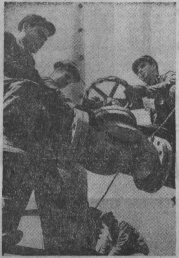
На строительстве кислородной станции Запсиб хорошо трудятся монтажники Западно-Сибирского управления треста «Сибметаллургмонтаж».