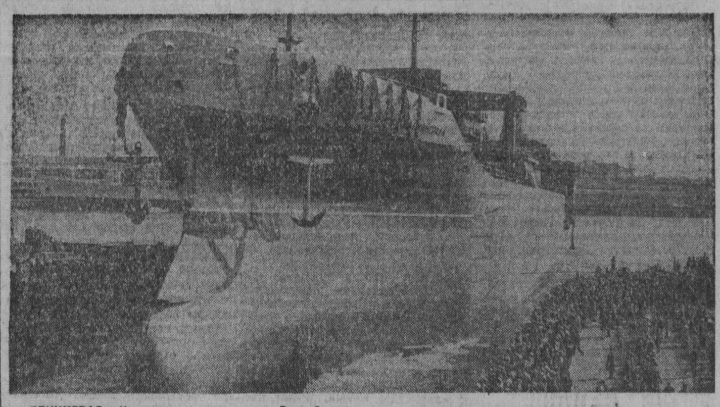
ЛЕНИНГРАД. На днях судостроители Балтийского завода закончили стальной корпус постройки и спустили на воду танкер «Номоскол» Ленинграда. Водоизмещение нового нефтесовалганта — 62.000 тонн. Он сооружается в честь пятилетия ВЛКСМ. НА СНИМКЕ: во время спуска танкера на воду.

Рейдовая бригада «Кузбасса», депутаты горсовета: М. КРАСИЛОВА — инженер Новокузнецкого отделения железной дороги, М. ИВАННИКОВА — заведующая магазином № 1 горплодоовощторга; Е. ПАС-ТУШЕНКО — корр. «Кузбасса».