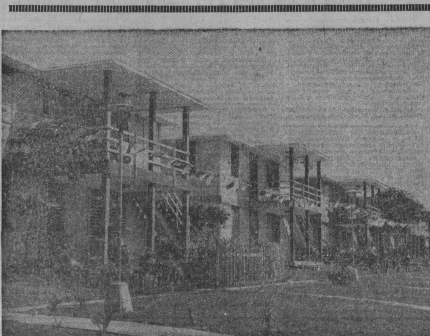
РЕСПУБЛИКА КУВА. Новые жилища дома государственной фирмы в Пинар-дель-Техо.

Наиболее высокие темпы роста в Чехословакии в минувшем году отмечены в машиностроении — 10,4 процента и в химической промышленности — 10,2 процента. Объем строительных работ возрос на 9,3 процента. В минувшем году в ЧССР получен самый высокий урожай зерновых за весь послевоенный период.