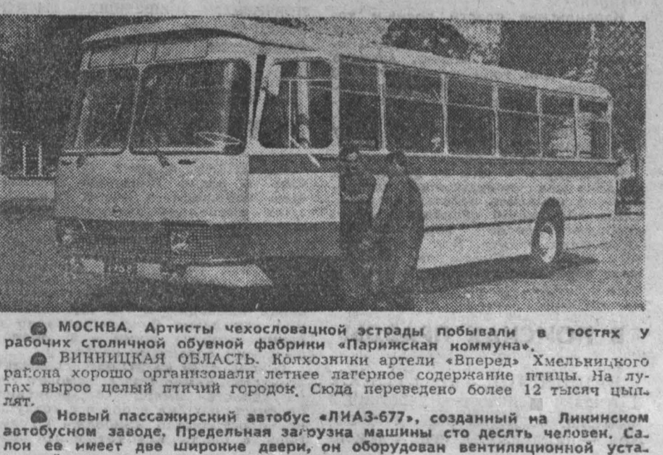
Новый пассажирский автобус «ЛИАЗ-677», созданный на Ленинском автобусном заводе. Предельная нагрузка машины сто десять человек. Салон ее имеет две широкие двери, он оборудован вентиляционной установкой и люминесцентным освещением.