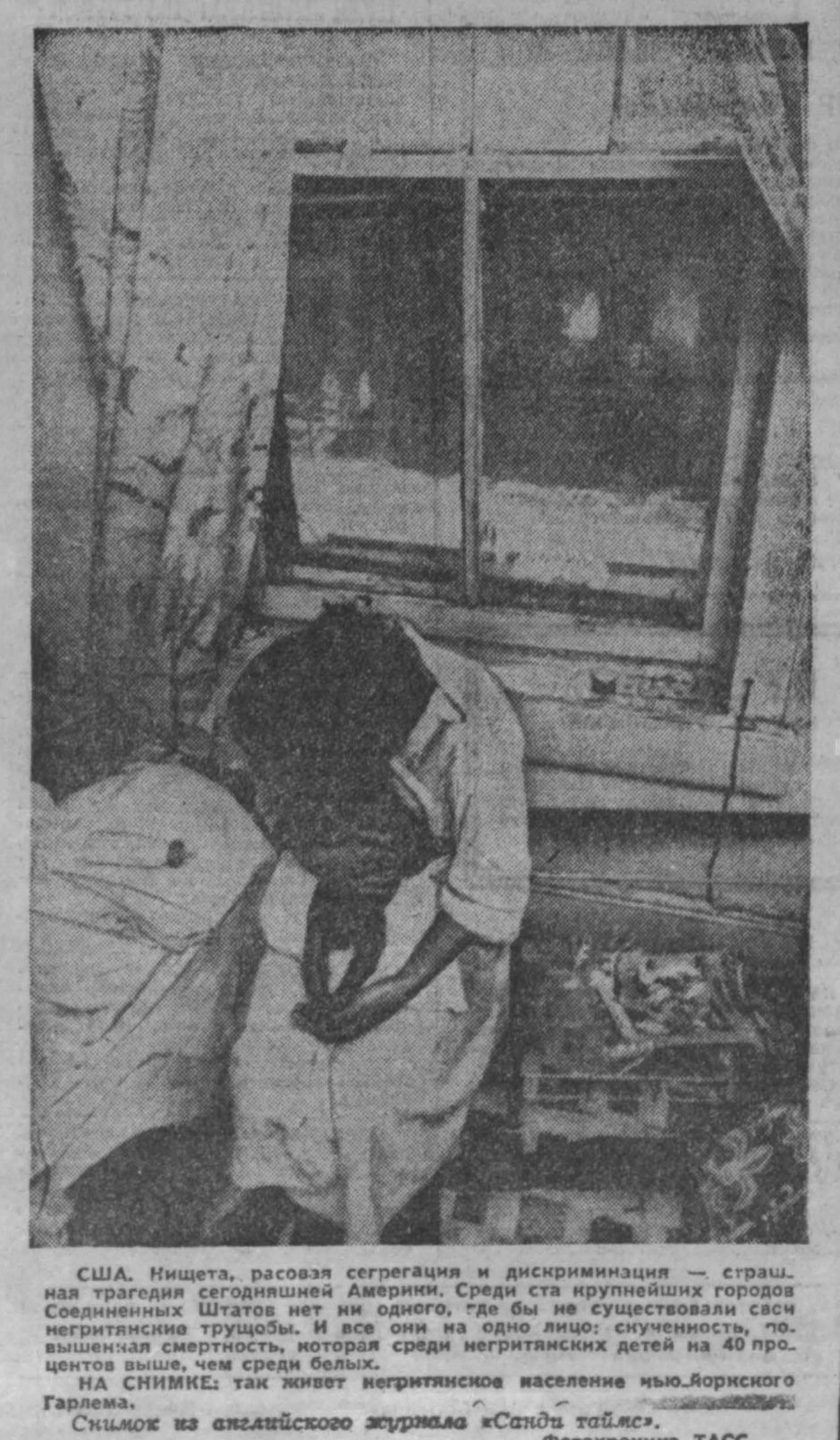
США. Нищета, расовая сегрегация и дискриминация — страшная трагедия современной Америки. Один из крупнейших городов Соединенных Штатов нет ни одного, где бы не существовали свои негритянские трущобы. И все они на одно лицо: сучиенность, лов, вышняя смертность, которая среди негритянских детей на 40 процентов выше, чем среди белых. НА СНИМКЕ: так живет негритянское население Нью-Йоркского Гарлема.

Киностудия «ДФА» разрабатывает технологию производства широкоформатных (70-миллиметровых) фильмов. Такой формат позволяет киноленте примерно втрое увеличить изображение и усилить его резкость. Новая техника раскрывает перед кинематографом возможности расширения сотрудничества с работниками кинематографии социалистических стран. (АПН—Панорама ГДР).