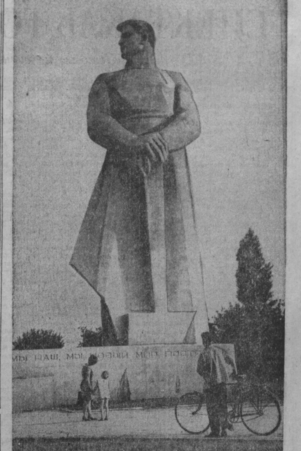
ЧЕЛОВЕКУ-СОЗИДАТЕЛЮ. Так называется двадцатиметровый монумент, сооруженный в Краснодаре.

5 июня в 7 часов вечера в клубе комхозмашзавода состоится вечер выпускников вечернего университета марксизма-ленинизма.