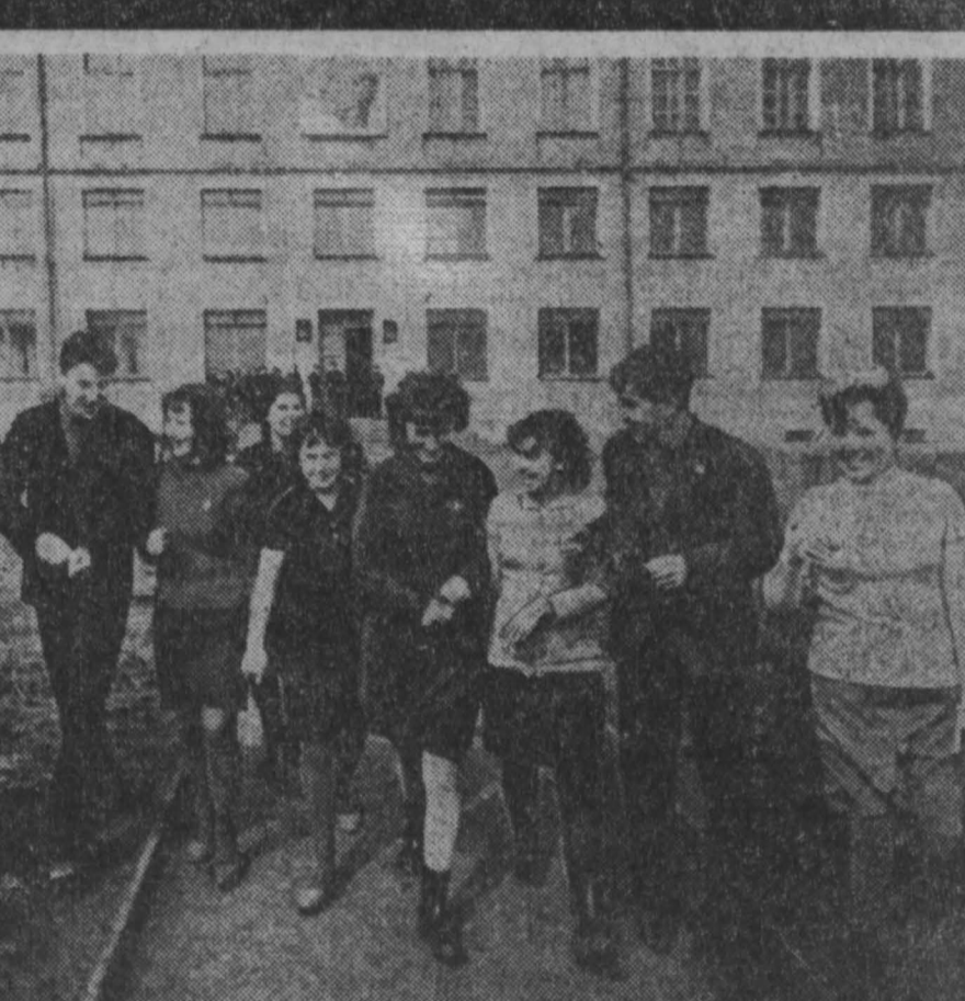
Каждый учебный класс — это своеобразная лаборатория. Здесь можно прослушать лекцию преподавателя, а потом по схеме, нарисованной на доске, разобрать прибор. Главный учебный корпус. Отсюда начинают свой путь будущие агронومی, механики, агрохимики. (Окончание на 4-й стр.)

В этом году резко возрастает число автоматических линий на предприятиях автомобилестроения. Значительный вклад в это вносит столичные станкостроители. Завод шифровальных станков отгружал в Уфу партию автоматов для обработки клапана автомобильного двигателя. Они будут встроены в автоматическую линию на Уфимском моторостроительном заводе. Новое оборудование в отличие от прежнего выпускавшегося для этой операции более надежно в эксплуатации, обеспечивает высокую чистоту и точность шлифовки. Благодаря автоматическому режиму работы оно во много раз производительнее. 12 секунд — такова продолжительность цикла обработки одной детали. 65 высокоточных автоматов и полуавтоматов различных моделей даст в этом году коллектив завода автомобилестроителям Москвы, Горького, Минска, Ярославля. (Корр. ТАСС.)