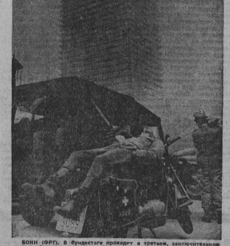
БОНН (ФРГ). В бундестаге проходит в третьем, заключительном чтении обсуждение чрезвычайных законов. Из страха перед массовыми выступлениями протеста трудящихся, которые охватили всю страну, бундесные власти ступили и зданию парламента усиленные меры полиции. НА СНИМКЕ: полицейские «откапывают» у здания бундестага в Бонне «рабочие». Телефон ЮПИ-ТАСС.

ХАНОЙ, 1 июня. (ТАСС). Американские агрессоры совершают новые преступления во Вьетнаме. Об этом говорится в переданном агентством ВИА коммюнике комиссии по расследованию преступлений американских империалистов во Вьетнаме, в котором осуждаются преступления, совершенные американцами в Северном Вьетнаме с 1 по 15 мая. В коммюнике подчеркивается, что с тех пор как президент США Джонсон объявил 31 марта об ограничении бомбардировок Северного Вьетнама, американская авиация продолжает совершать массированные налеты на значительную часть ДРВ, простирающуюся от демилитаризованной зоны до провинции Тханьхоа. За первые 15 дней мая, говорится в коммюнике, американские самолеты подвергли бомбардировкам свыше 600 населенных районов и экономических объектов Северного Вьетнама, сбросив 14.000 фугасных бомб и бомб замедленного действия на всем протяжении от Тханьхоа до Куангбиня. Ежедневно американская авиация совершала в среднем 111 налетов на ДРВ. Американские самолеты разрушили еще две школы в провинциях Нган и Хатинь, подвергли бомбардировкам два медулунта в провинции Хатинь, бомбили 15 сельскохозяйственных кооперативов. В коммюнике подчеркивается, что, наряду с ожесточенными бомбардировками населенных районов, американские империалисты продолжают другие действия против ДРВ.