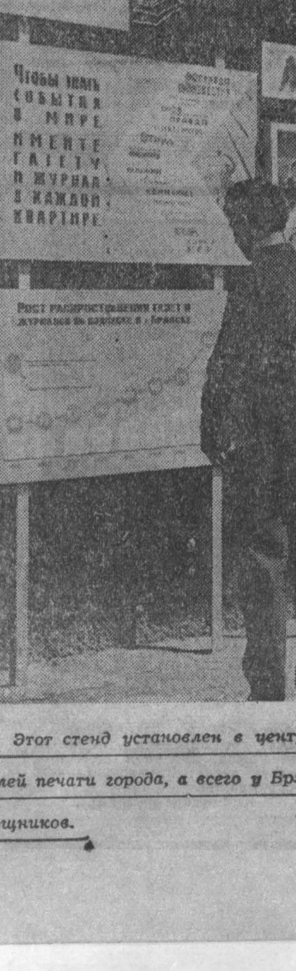
Этот стенд установлен в центре Бранска. На нем помещены фотографии лучших распространителей печати города, а всего у Бранского отделения «Союзпечати» около 5 тысяч добровольцев-полюсников.

Такой учет позволяет горнякам постоянно контролировать свою экономическую деятельность, следить за ходом выполнения социалистических обязательств. За 4 месяца коллектив участка сэкономил 11,448 руб.