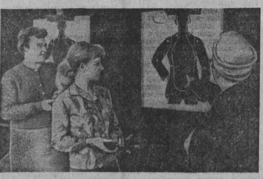
США. Этот снимок сделан в польском городе Дирборн, что под Детройтом. «Добропорядочные» домохозяйки рассматривают результаты попадания в миску, изображающей... инга.