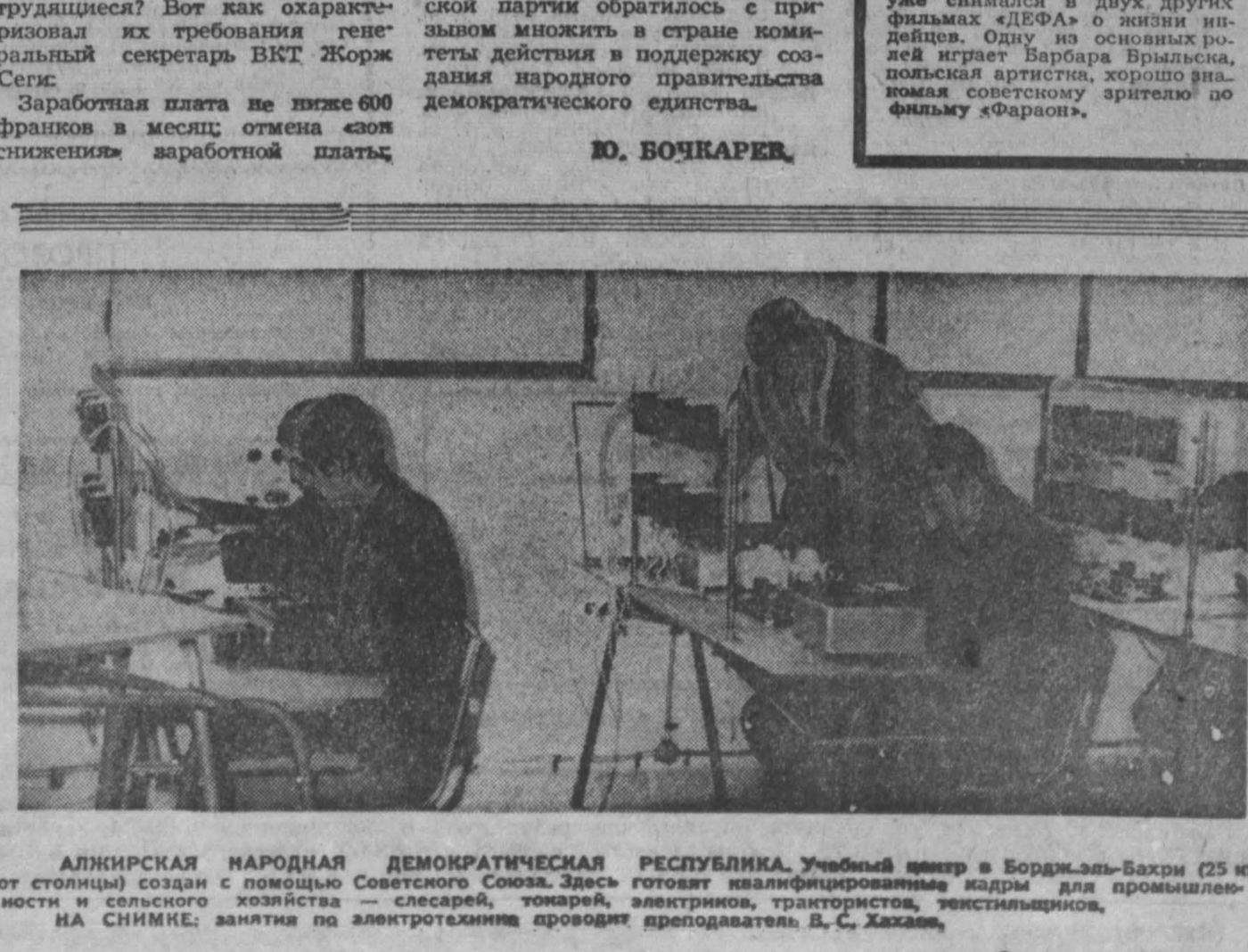
АЛЖИРСКАЯ НАРОДНАЯ ДЕМОКРАТИЧЕСКАЯ РЕСПУБЛИКА. Учебный вечер в Борж-эль-Бахри (25 км от столицы) создан с помощью Советского Союза...

Однако врачи не просто регистраторы событий. По их инициативе выданы десятки предложений, направленных на оздоровление условий труда и предупреждение загрязнения внешней среды.