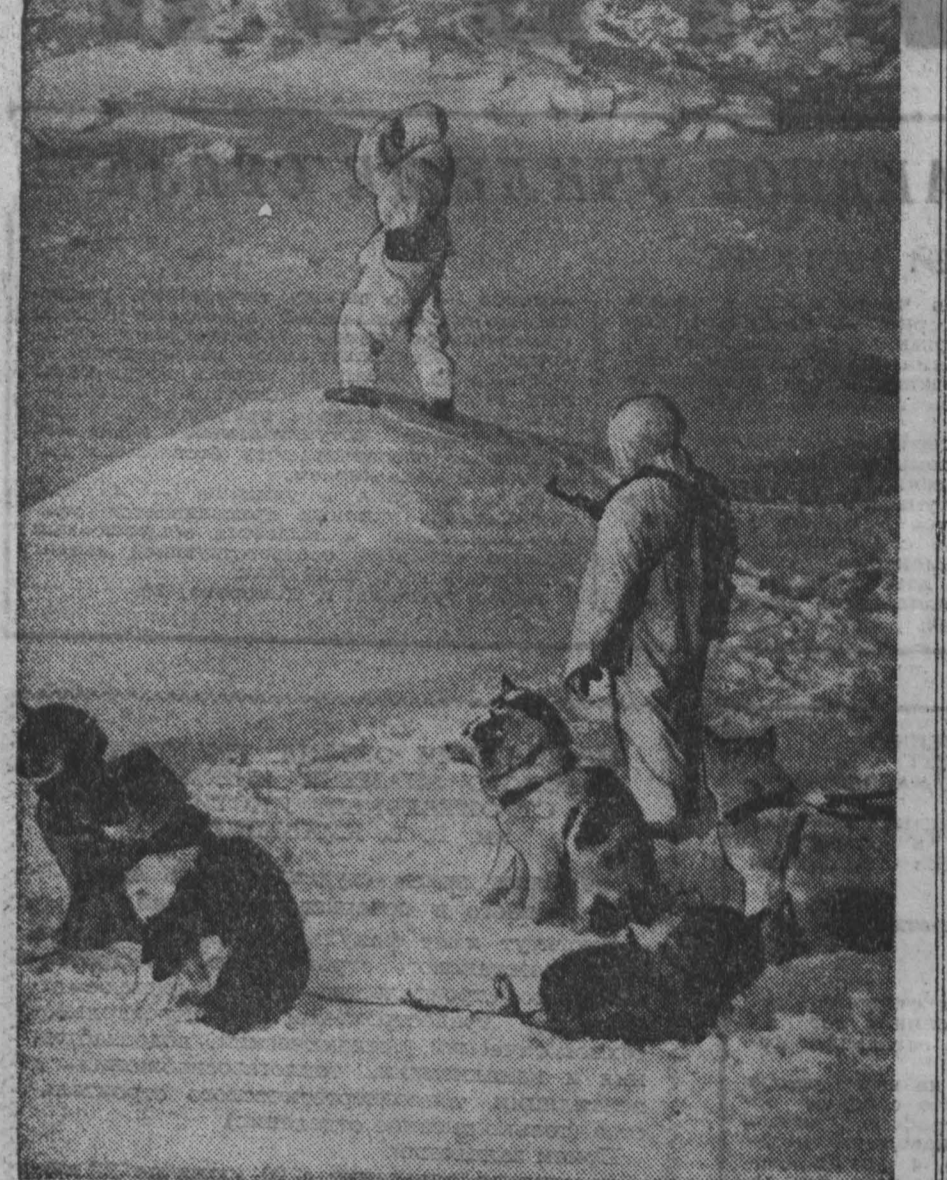
На самом краю советской земли, там, где Берингов пролив соединяет Ледовитый и Тихий океаны, проходит 180-й меридиан, делаящий землю на два полушария. Скалистыми берегами Чукотки кончается Азия, а за проливом — уже Америка. Здесь же проходит Государственная граница СССР. Участок ее, который охраняется бойцами Н-ской погранкиной заставы, расположен вдоль Ледовитого океана. По тундре среди скал, рвов и торосов проходит джорная тропа. Не всегда на пост можно добраться пешком. В таких случаях пограничники выгружают вертолет и... собакам управляют. Пограничники в суровых условиях Заполярья день и ночь бездельно несут свою службу. НА СНИМКЕ: наряд пограничников в дозоре.

АММАН, 28 мая. (ТАСС). Между иорданскими и израильскими войсками вчера снова произошла перестрелка на линии прекращения огня. Как заявил здесь представитель нью-йоркского военного командования, израильские войска обстреляли иорданские позиции в северной части долины реки Иордан. Иорданская сторона открыла ответный огонь. Перестрелка продолжалась два часа.