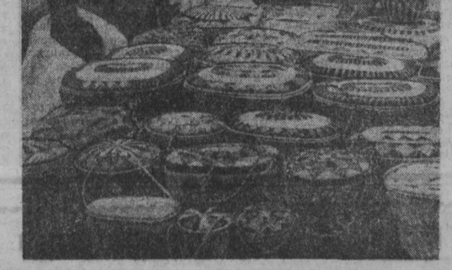
Семена в магнитном вихре

«Каково влияние труда человека на продолжительность его жизни?» — Еще древние говорили: долго жить не живут. Я с ними солидарен. Только труд может способствовать долголетию.