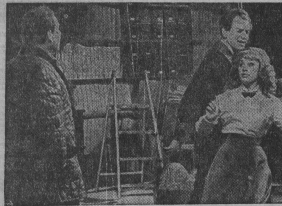
ВЫ ЭТОГО НЕ ЗНАЛИ