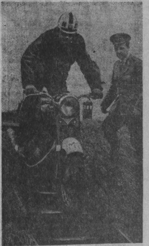
ПОЛЬША. Так тренируются спортсмены-мотоциклисты варшавской городской милиции.