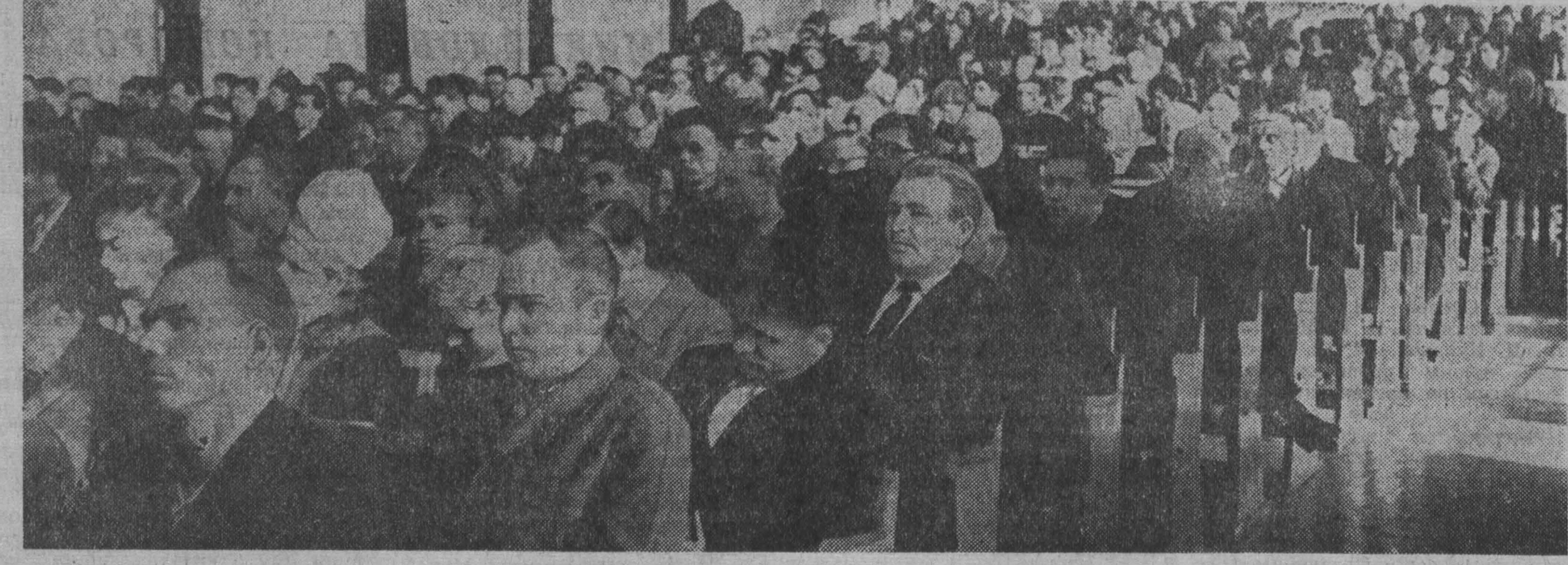
Идет совещание рабселькоров.

ДАЛЕКО от таяющего сибирского поселка на Натальевке, что в Тисульском районе, до венгерского села Яко. Но сократились большие расстояния с тех пор, как завязалась переписка ребят из Натальевской восьмилетней школы с пионерами венгерского села.