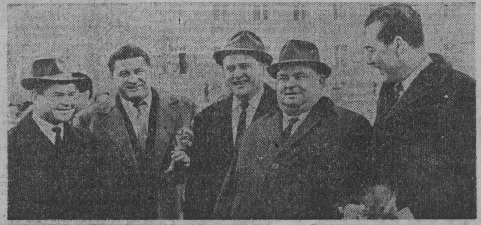
НА СНИМКЕ: венгерские гости.