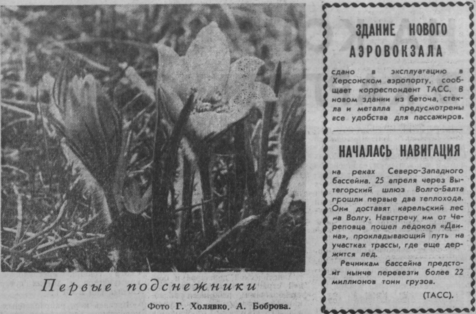
Первые подснежники.

Городская комиссия по проведению праздника. Р. Я. Троицкий.