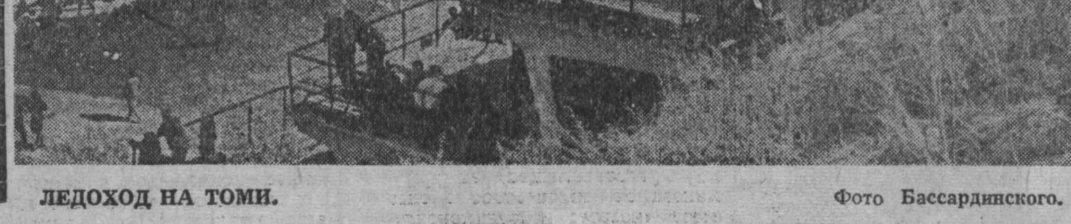
ЛЕДОХОД НА ТОМИ.

В специальном разделе книги даны консультации по вопросам, связанным с использованием на практике «Положения о социалистическом государственном производственном предприятии», утвержденного Советом Министров СССР 4 октября 1965 года. Е. КАРДАШ.