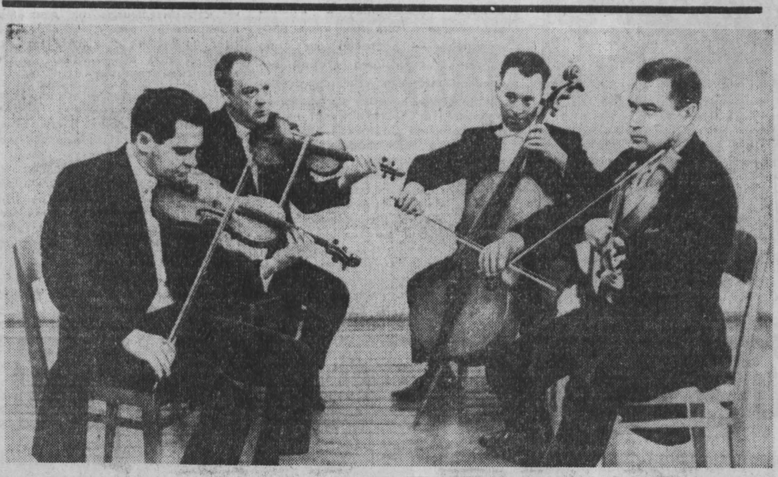
НА ГАСТРОЛИ в Кузбасс приехал квартет имени Бородина. Позавчера и вчера в помещении детской музыкальной школы состоялись первые концерты этого коллектива. Инициатором проведения лауреата Ленинской премии Д. Шокалова. НА СНИМКЕ: выступает квартет имени Бородина.

«Спартак» 38 63 238-83 ЦСКА (Ленинград) 44 53 159-140 «Динамо» (Москва) 37 47 156-97 «Крылья Советов» 37 44 137-111 «Химик» 40 41 120-140 «Локомотив» 39 40 140-123 «Торпедо» (Горьк.) 40 37 106-136 «Сибирь» (Новосиб.) 44 29 120-144 «Динамо» (Киев) 41 28 115-183 «Металлург» 44 20 101-218 «Торпедо» (Нижн.) 43 106-218 В чемпионате страны, который финиширует в начале мая, осталось провести 22 матча. (ТАСС).