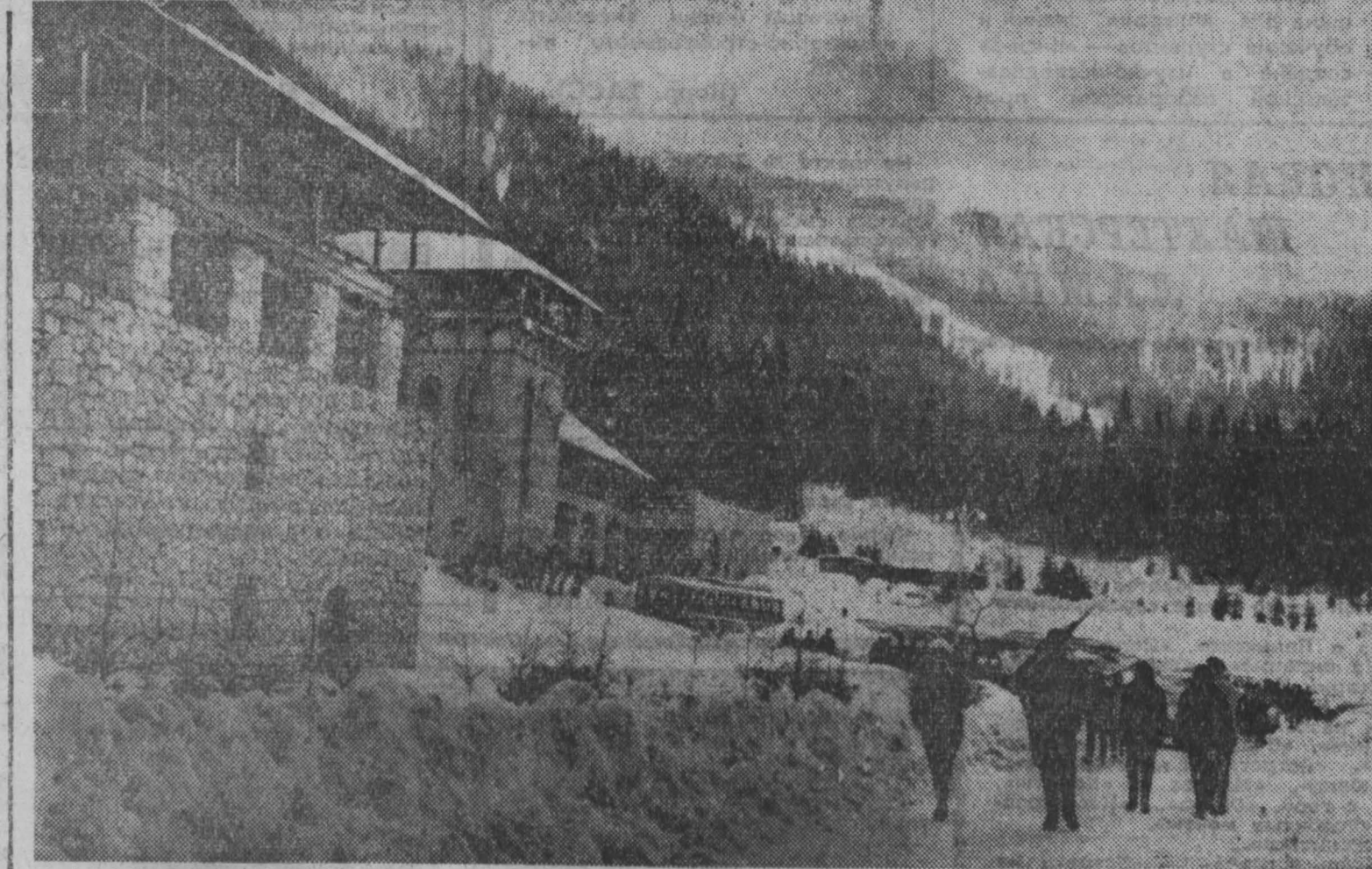
РУМЫНИЯ. Гостиница «Спорт» в Поиме-Брашов. Отсюда открывается вид на горный массив Поставару.

Время от времени нам удаётся взглянуть на ход истории под каким-то личным углом зрения, благодаря чему все вдруг становится яснее, понятнее, позволяющим, с надеждой смотреть в будущее. Однако в наши дни нам все труднее становится выработать такой ясный взгляд на вещи. Для того, чтобы попытаться осознать