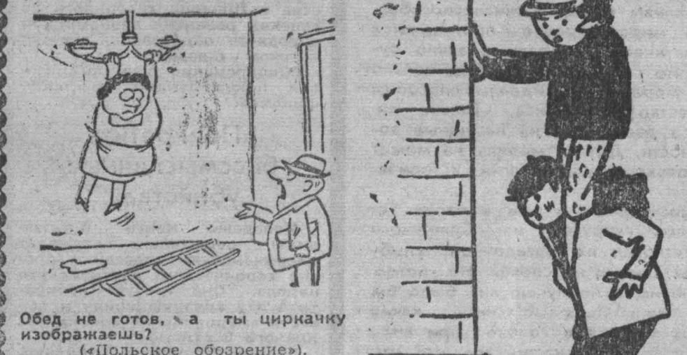
Рис. В. Гонтера.

Обед не готов, а ты циркачку избралаш! (Польское обозрение).