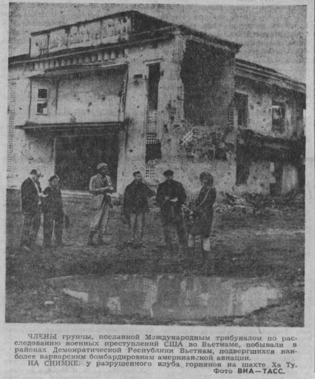
Члены группы, посланной Международным трибуналом по расследованию военных преступлений США во Вьетнаме, побывали в районах Демократической Республики Вьетнам, подвергшихся наиболее варварским бомбардировкам американской авиации. НА СНИМКЕ: у возвращенного клуба горючего на шахте Ха Ту.