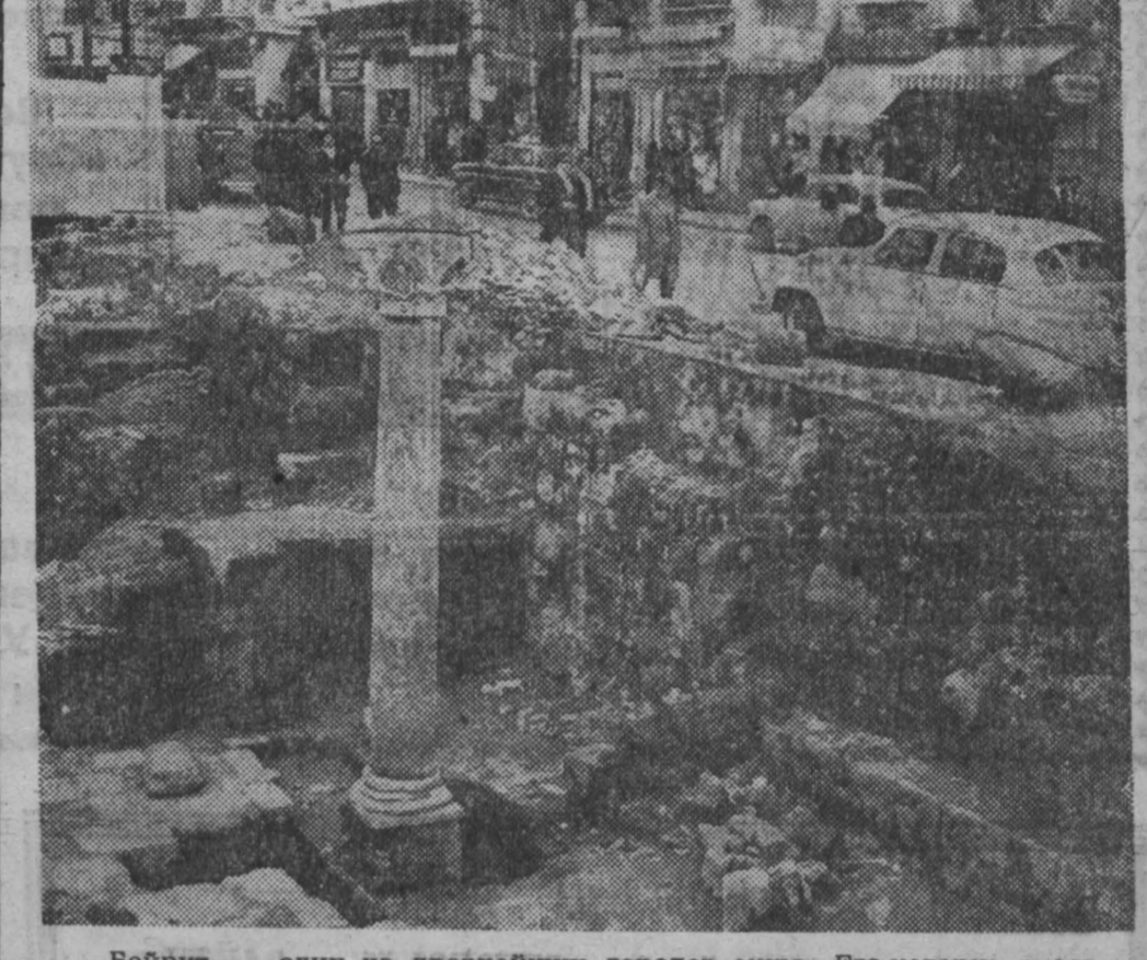
Вейрут — один из древнейших городов мира. Его история знает расцвет финикийского государства, походы Александром Македонским, времена владычества Римской империи. И по сей день археологи или обычные строители находят в различных частях города остатки древней культуры.

НА СНИМКЕ: в ходе земляных работ на улице Ваб-Идрис (центральный торговый район города) строители наткнулись на хорошо сохранившиеся остатки части города, относящиеся к II-III вв. (Римская империя).