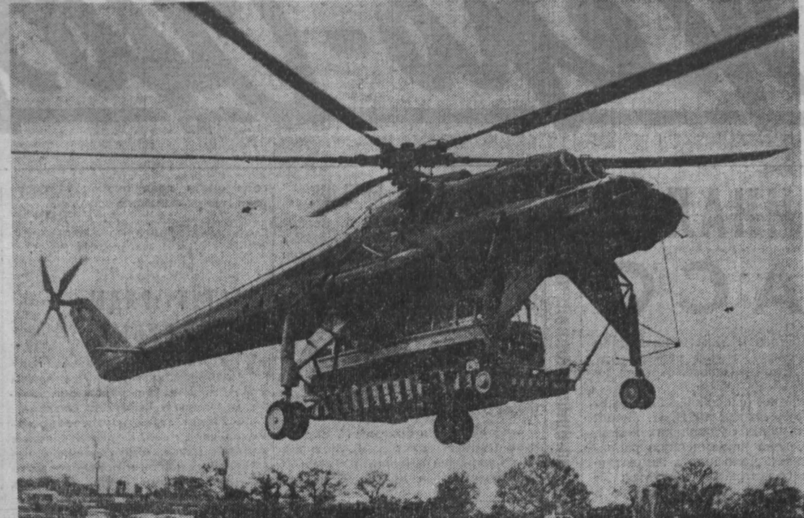
АНГЛИЯ. Советский вертолет Ми-10, завоевавший признание во многих странах Европы, побывал недавно в Англии. На аэродроме Гатвик, около Лондона, перед представителями фирмы, заинтересованной в приобретении вертолета, демонстрировался его грузоподъемные качества. Советский вертолет может свободно транспортировать грузы до 25 тонн весом. НА СНИМКЕ: вертолет Ми-10 поднимает в воздух автобус с аэродрома Гатвик.

Газетам также запрещается любое упоминание о политических партиях, которые были распущены после взятия военными в свои руки власти в Сьерра Леоне.