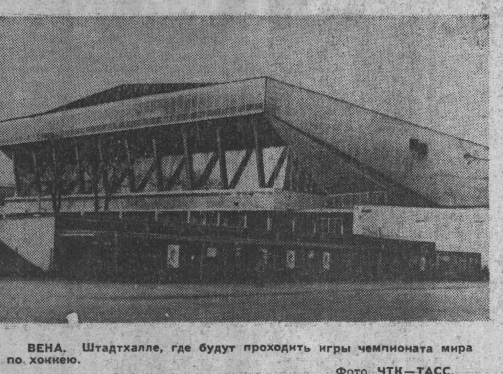
ВЕНА. Штабталле, где будут проходить игры чемпионата мира по хоккею.