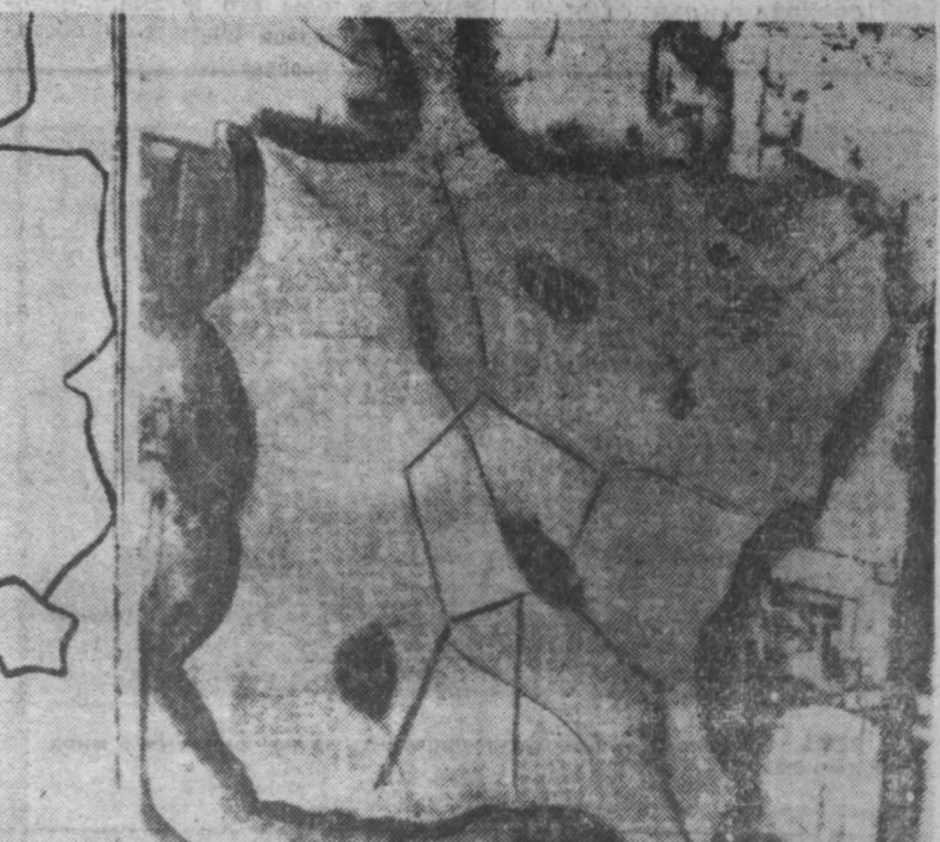
Поразительное сходство, не правда ли? Однако авторы проекта архитекторы Ф. Отто и Р. Гутборг равно как и генеральный секретарь сейши ФРГ на выставке фон Сименс, утверждая, что... это случайность. Не полагаясь на их заверения, канадские власти решили заняться расследованием этой «случайности». Поражает наглость тех, кто решился использовать международную выставку для пропаганды своей реакционной политики. Из канадской газеты «Торонто Делли Стар».