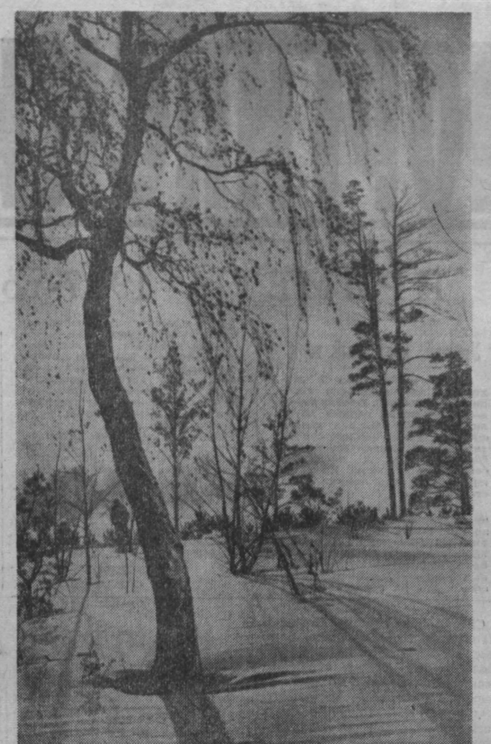
И. А. ШРАЕР

Марк ПАВЕРМАН, народный артист РСФСР, главный дирижер Свердловского Государственного симфонического оркестра.