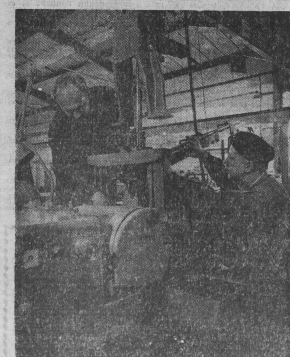
Более чем в 30 стран всех континентов экспортирует Чехословакия изделия своей машиностроительной промышленности. Большой успех на мировом рынке получают металлообрабатывающие станки, станки, самолеты, электровозы, автомобили, оптические приборы, различное оборудование для металлургической промышленности. В центре завода ТАС в Голлице. Здесь заканчивается производство бесцентровых шлифовальных станков, предназначенных для автомобильного завода в Мелитополе (СССР). Фото ЧТК—ТАСС.