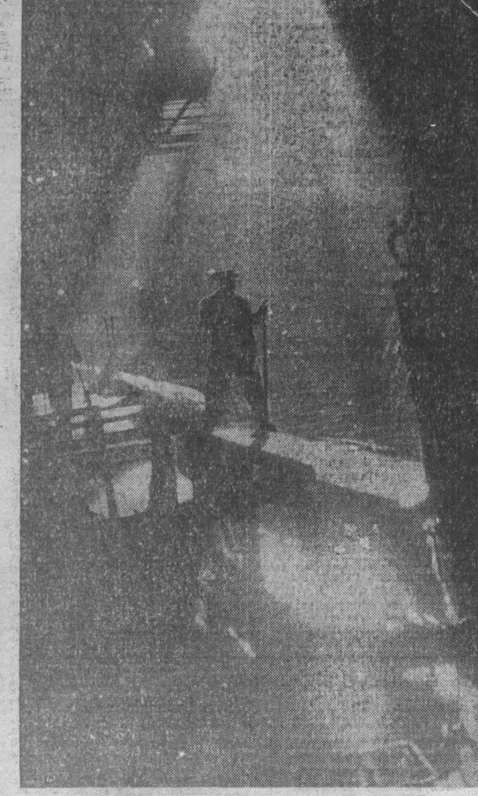
Успешно завершили первый месяц юбилейного года проработки Кузнецкого металлургического комбината. Ими прокатаны сотни тонн металла дополнительно к плану. Больше всех записал на свой сверхплановый счет коллектив коммунистического труда обнинского цеха. Среднесортный цех прилпосовал 317 тонн. Сортопркатный и листопрокатный — по 110 тонн.

Е. АКТЕНЬЕВ, директор Ленинск-Кузнецкой лесоторговой базы.