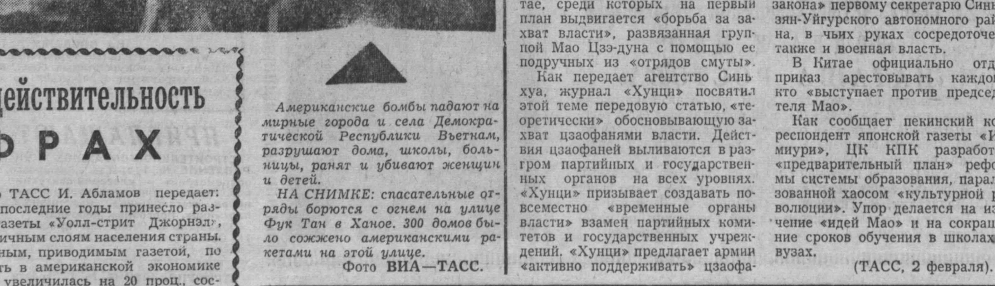
Американские бомбы падают на мирные города и села Демократической Республики Вьетнам.

В Китае официально отдают приказ арестовать каждого, кто «выступает против председателя Мао».