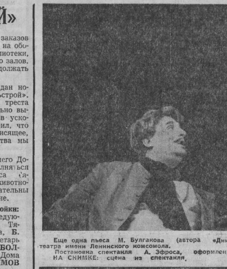
Еще одна пьеса М. Булгакова (автора «Дни Турбиных») «Мольер» поставлена на сцене Московского театра имени Ленинского комсомола.

Десять дней дети поселка Ходы, что в Уссурийской тайге, ходили в шкиму под охраной охотника, регистрирует корреспондент ТАСС из Хабаровска. Такая предосторожность была вызвана появлением здесь незнакомых гостей — тигрицы. В поселке ее не трогали: охота на уссурийских тигров запрещена.