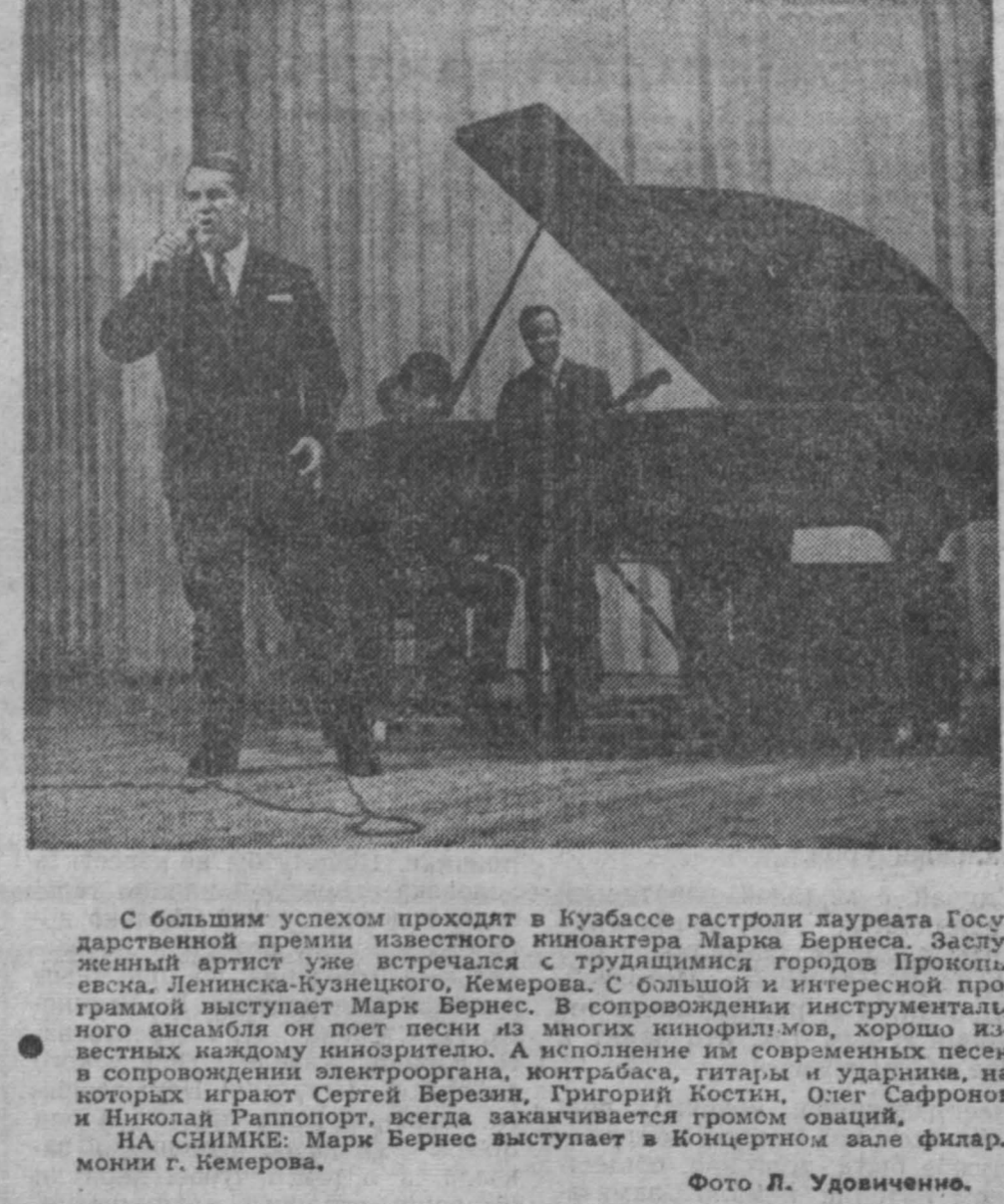
С большим успехом проходит в Кузбассе гастроли лауреата Государственной премии известного артиста Марка Бернеса.

Здесь наша земля. А там, за чертой, что идет по песням, по вершинам гор, через тайгу и вдоль рен, — чужая. И тишина. Коварна, вечно тающая опасность, с ней всегда ассоциируется понятие — граница.