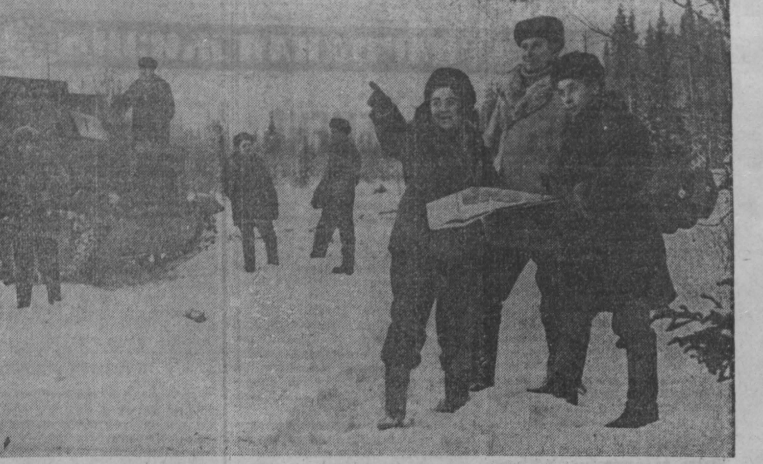
В мороз и жару ведут разведку недр отважные геологи. Усиленная геологическая экспедиция треста «Кузбассуглегеология» с 1945 года занимается разведкой угольных пластов. Она определяет ныне действующие поля шахт, карьеров Томь-Усинского угольного месторождения. Сейчас коллектив геологов и гео-

Рабочие и служащие, получающие единовременное вознаграждение за выслугу лет, могут при желании перечислить часть или всю сумму вознаграждения в качестве вклада в сберегательную кассу. Для этого необходимо подать в расчетную часть своего предприятия или учреждения письменное заявление, указав в нем, в какую сберегательную кассу и в какой сумме должно быть сделано перечисление. Вознаграждение за выслугу лет может быть перечислено как на ранее открытый счет, так и на новый. Сберегательные кассы обеспечивают надежное, выгодное и удобное хранение сбережений. По вкладам, внесенным в сберегательные кассы, вкладчикам выплачивается доход в виде процентов или выигрышей. Сокращаются денежные сумм, внесенных сберегательным кассам, гарантируется правительством СССР.