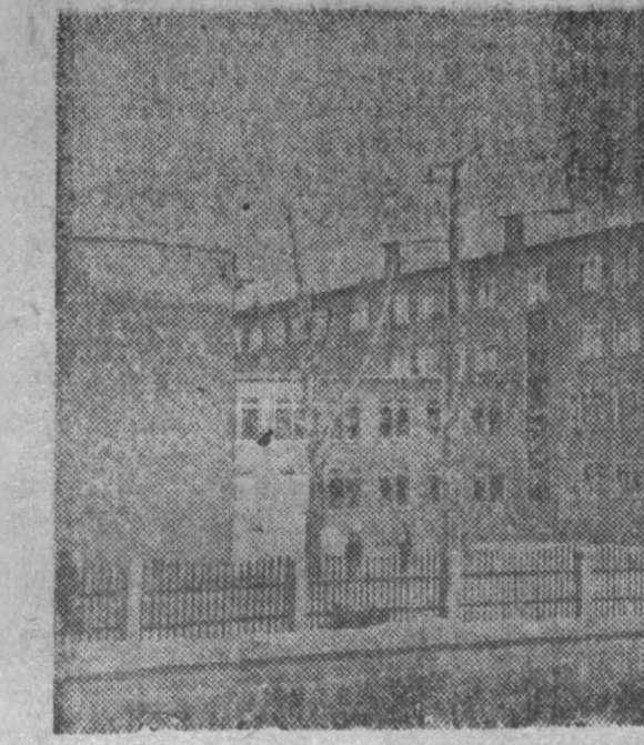
Зайдемте во Дворец. По правде сказать, его хозяевам сейчас очень некогда. Только что подошла последняя машина с оборудованием и мебелью, ее разгружают. А в комнатах уже идут занятия кружков. Их здесь 17. Посещает кружки свыше полутора тысяч детей.