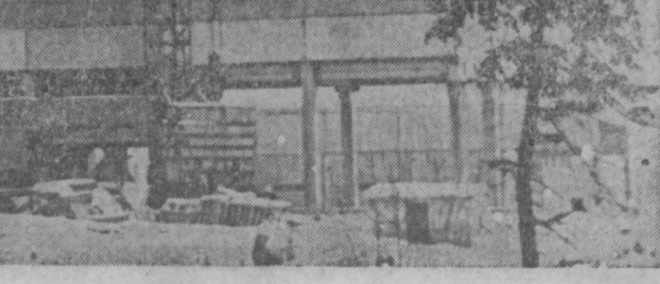
Фабрика птичьего мяса

АНГАРСК. В живописном состоянии бору близ Ангарска поднимается производственный корпус крупной птицефабрики. Ангарские птицеводы вырастят первый миллион цыплят-бройлеров и два миллиона высококачественного птичьего мяса. Себестоимость одного центнера мяса снижена по сравнению с прошлым годом на 45 рублей.