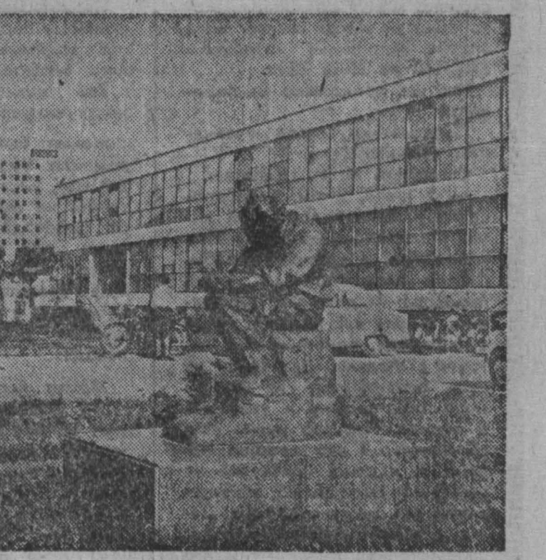
НА СНИМКЕ: рабочий университет имени Моше Пьяде в Загреб...

АНКАРА, 23 ноября. (ТАСС). После того, как послы Греции в Анкаре посетил вчера министра иностранных дел Турции и сообщил ему, что условия Турции не могут быть приняты, поздно вечером состоялось заседание турецкого кабинета министров, которое продолжалось до утра. Представитель турецкого правительства государственный министр Сейфи Озтокер заявил сегодня, что Турция отклоняет предложение Греции начать переговоры по кипрской проблеме и настаивает на своем праве защищать турок-киприотов. Представитель правительства подчеркнул, что Турция не удовлетворена греческим ответом на ноту турецкого правительства. Турецкое правительство настаивает на защите безопасности кипрских турок, добавил он.