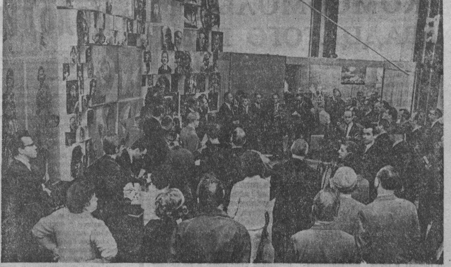
В Гамбурге — крупнейшем промышленном и портовом центре ФРГ — открыта выставка советского фотоискусства «СССР — 1917—1967».

мерно в 115 км юго-восточнее Скопье. Сила подземного толчка в эпицентре достигала 6 баллов. Землетрясение принесло незначительный материальный ущерб.