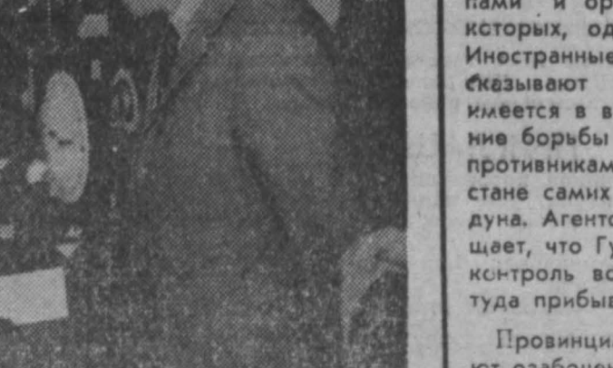
ВЕРЛИН. В столице ГДР открыта выставка «Народное образование в СССР за 50 лет». Экспозиция, дающая своеобразный исторический обзор этой темы, выполняет также роль информационного центра для немецких педагогов.

ПЕКИН. (ТАСС). Правительство КНР объявило о «временном закрытии» посольства и консульств КНР в Индонезии и об отзыве оттуда всех работников посольства и консульств Китая. Об этом говорится в переданном агентством Синьхуа заявлении правительства КНР.