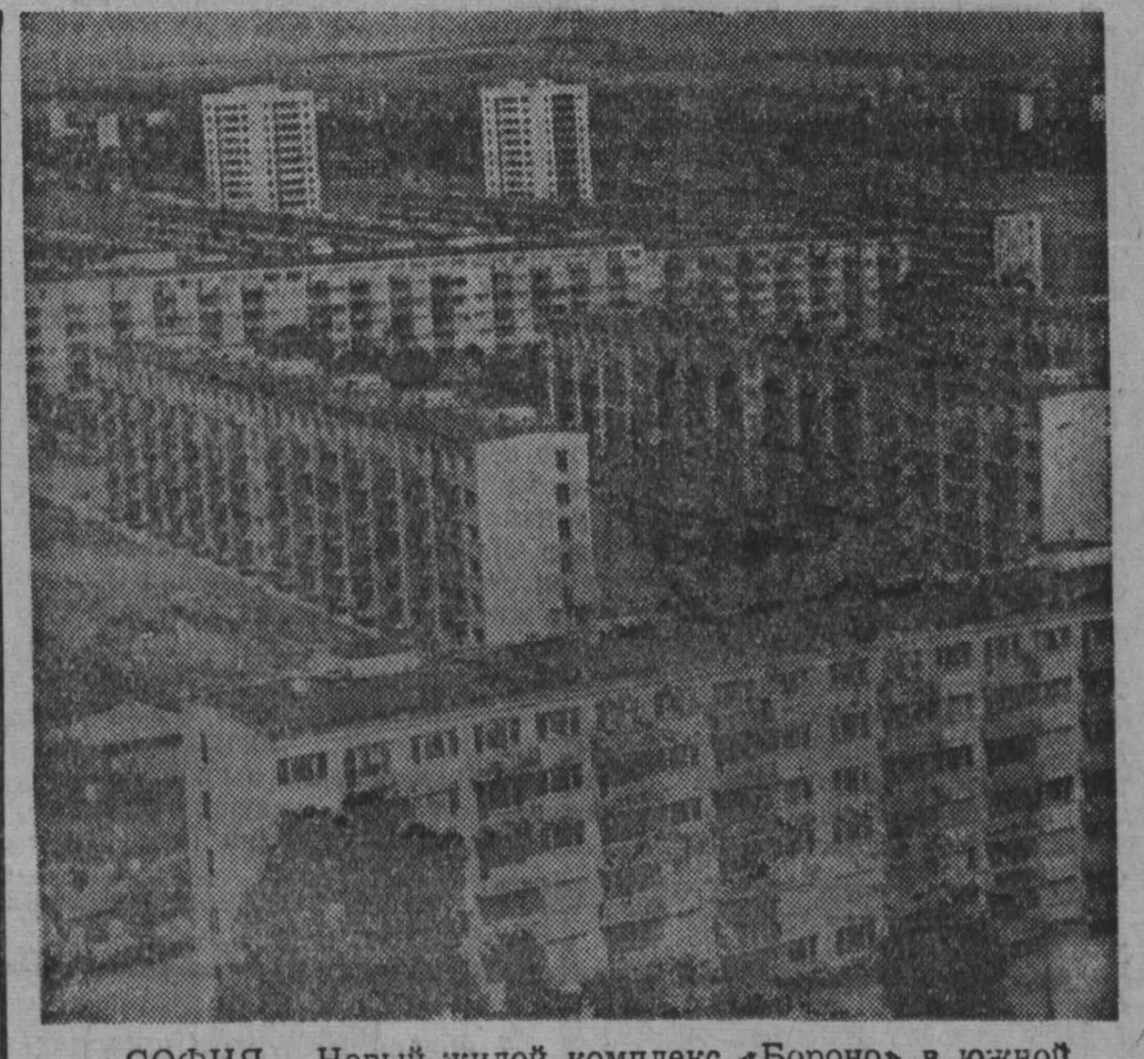
СОФИЯ. Новый жилой комплекс «Борон» в южной части города. Большое жилищное строительство ведется в столице Народной Республики Болгарии. Только до конца этого года здесь будут сдааны в эксплуатацию 8 с половиной тысяч новых квартир. Здания сооружаются преимущественно индустриальными методами.

Другая газета «Цзяньин жибао» сообщила, что «производственная канцелярия» Цзяньинского военного округа провела совещание по вопросам сбора налогов и заготовки продовольствия. Как пишет газета, на совещании были разработаны меры по преодолению «трудностей в работе по сбору налогов и заготовке продовольствия». Вооруженные силы упоминаются в газетных сообщениях в связи с попытками решить другие экономические проблемы. Командование стального горнозавода, как сообщают 28 октября пекинские газеты, провело совещание «по оказанию помощи» уральской промышленности Северного Китая. Вопрос о «помощи со