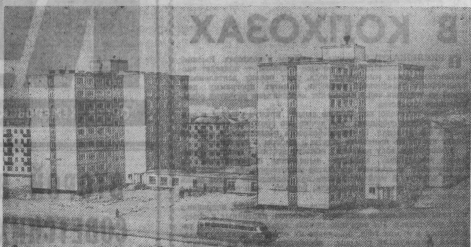
В первом году этой пятиточной кемеровчане получили 130 тыс. квадратных метров жилой площади. А в 1970 году жители областного центра получат 300 тыс. кв. метров. НА СНИМКЕ: первые девятиэтажные дома в новом квартале по улице Гагарина.