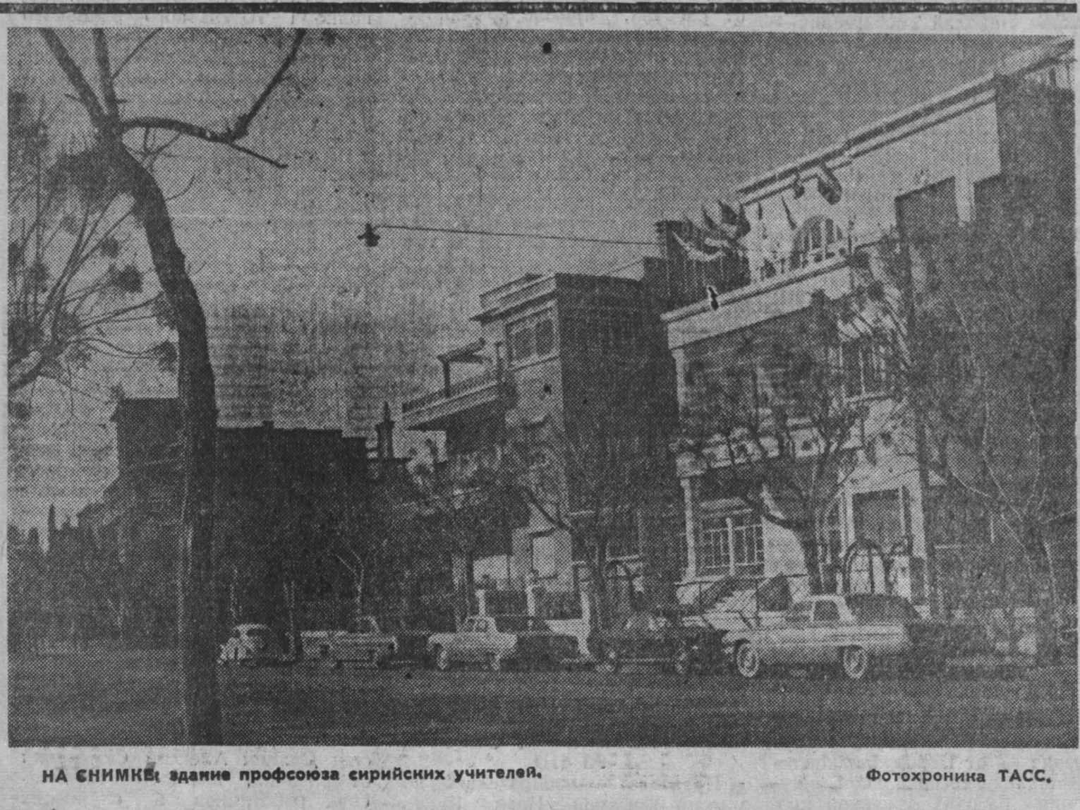
НА СНИМКЕ: здание профсоюза сирийских учителей.

Неизвестно, когда будет восстановлено движение по главной шоссеиной магистрали Рио-де-Жанейро — Сан-Паулу, значительные участки которой разрушены. Срочные грузы направляются по железной дороге. Однако поезда идут с малой скоростью из-за опасности аварий. По данным печати, число жертв в результате наводнений, обвалов и связанных с ними автомобильных катастроф достигло уже 600 человек.