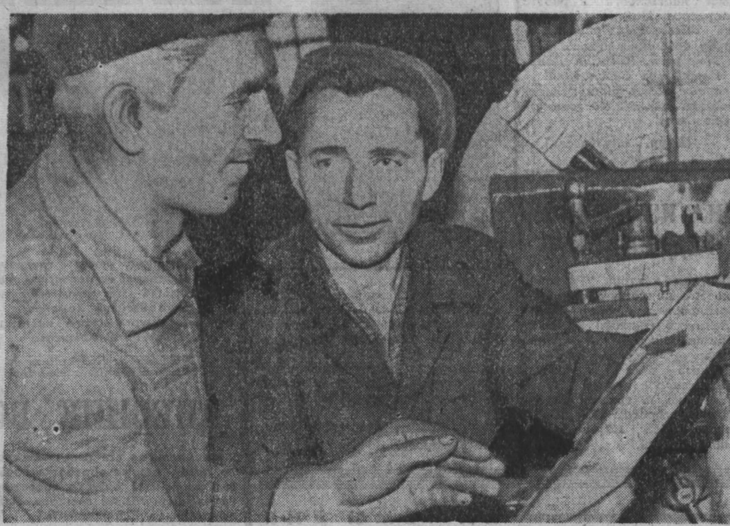
Горизонт «Пяťсот двадцать»