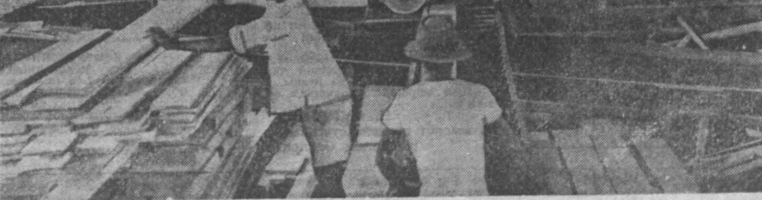
Для удовлетворения местных нужд и потребности соседних стран в Центральноафриканской Республике работают семь лесопильных заводов. Ежегодно они производят до 50.000 кубометров пиломатериалов. НА СНИМКЕ: один из лесопильных заводов Центральноафриканской Республики.

Р. ЛОКВУД, австралийский журналист. (АПН).