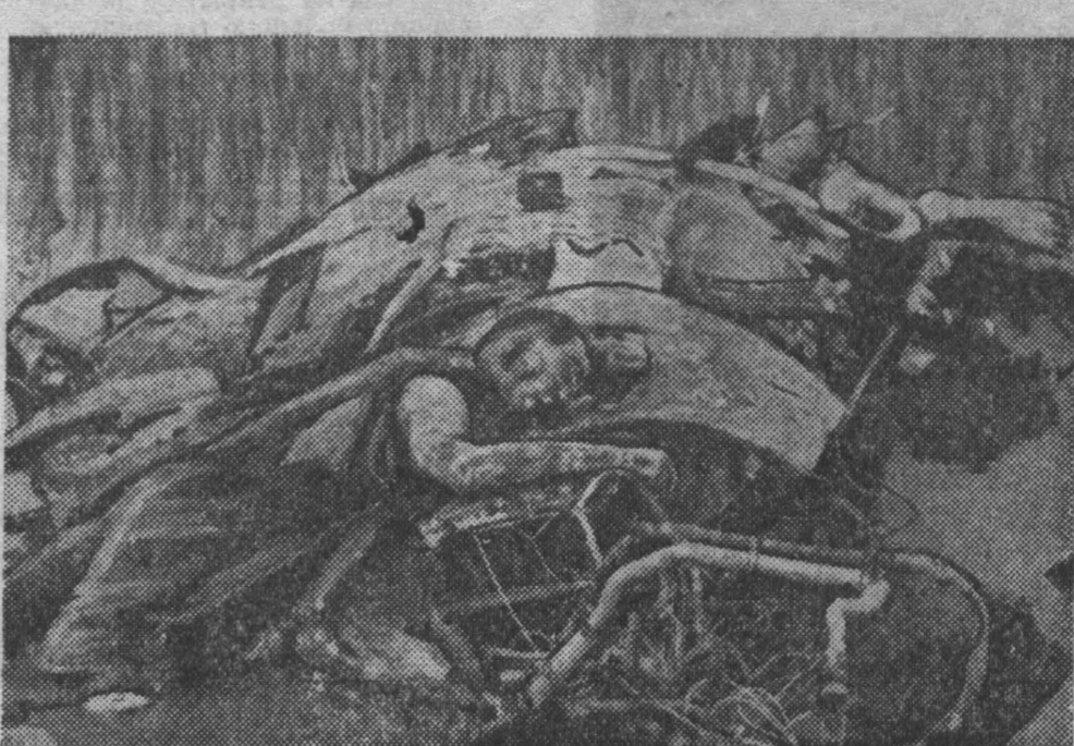
ДЕМОКРАТИЧЕСКАЯ РЕСПУБЛИКА ВЬЕТНАМ. Самоотверженный труд вьетнамского народа охраняют защитники неба — зенитчики. Достояний отпор получают американские агрессоры. Объятые пламенем падают на землю самолеты, нарушающие воздушные границы. В небе Вьетнама нашли смерть многие американские пилоты. НА СНИМКЕ: печальный конец нашел себе американский летчик на земле Вьетнама.