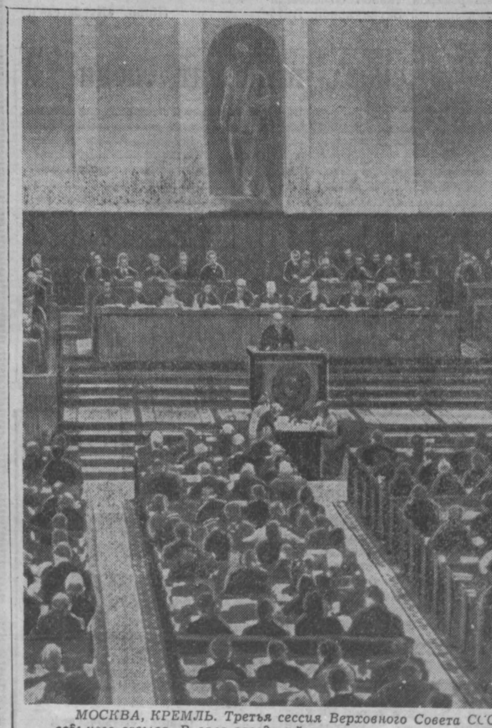
МОСКВА, КРЕМЛЬ. Третья сессия Верховного Совета СССР седьмого созыва. В зале заседаний.

11 октября сессия Верховного Совета СССР продолжила свою работу, (ТАСС).