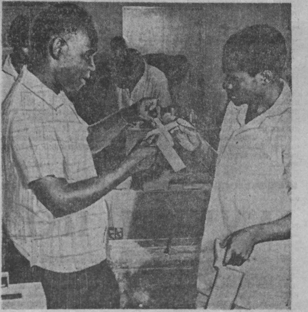
ЗАМБИЯ. Институт Кафуе — одно из старейших высших учебных заведений в стране.

ПАРИЖ, 6 октября. (ТАСС). В Греции продолжают аресты противников военной хунты. Как сообщает агентство Франс Пресс, по подозрению в организации взрывов в греческой столице на днях были арестованы 60 человек.