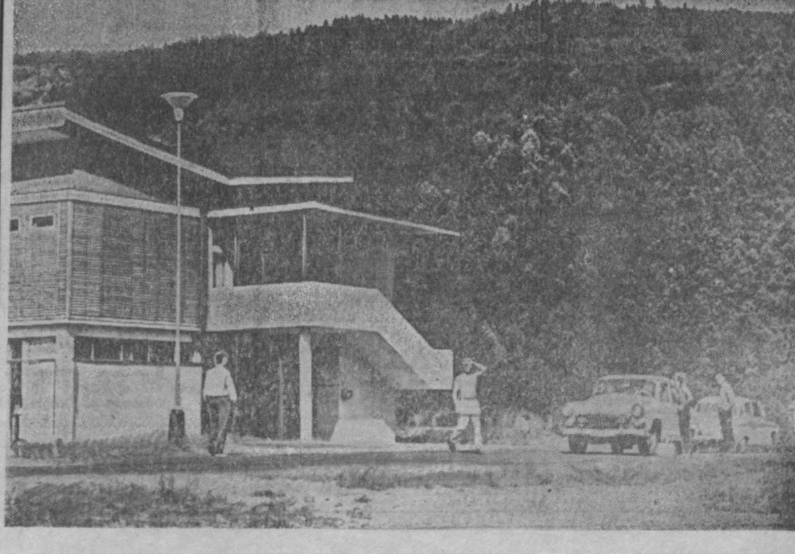
СССР. Мотель в Нижних Татрах. Любители автомобильных путешествий с удовольствием останавливаются здесь для кратковременного отдыха.

АДИСС-АБЕБА. По данным переписки, проведенной в конце сентября муниципальным эфиопским управлением, в Аддис-Абебе проживает 637,631 человек. В 1962 году, когда проводилась последняя перепись, в столице Эфиопии проживало 412,000 человек. (ТАСС).