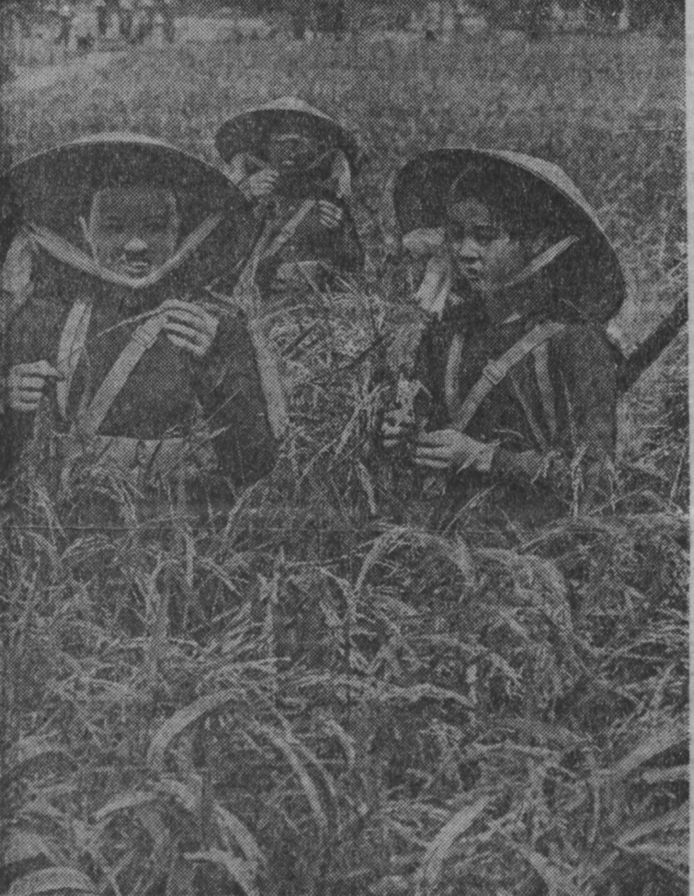
ДРВ. Получить в среднем по пять тонн риса с гектара — таковы обязательства многих кооперативов. Гидрофоний урочай на рисовых полях Вьетнама намеревается собрать впервые. НА СНИМКЕ: члены кооператива Хонг Хонг на рисовом поле.