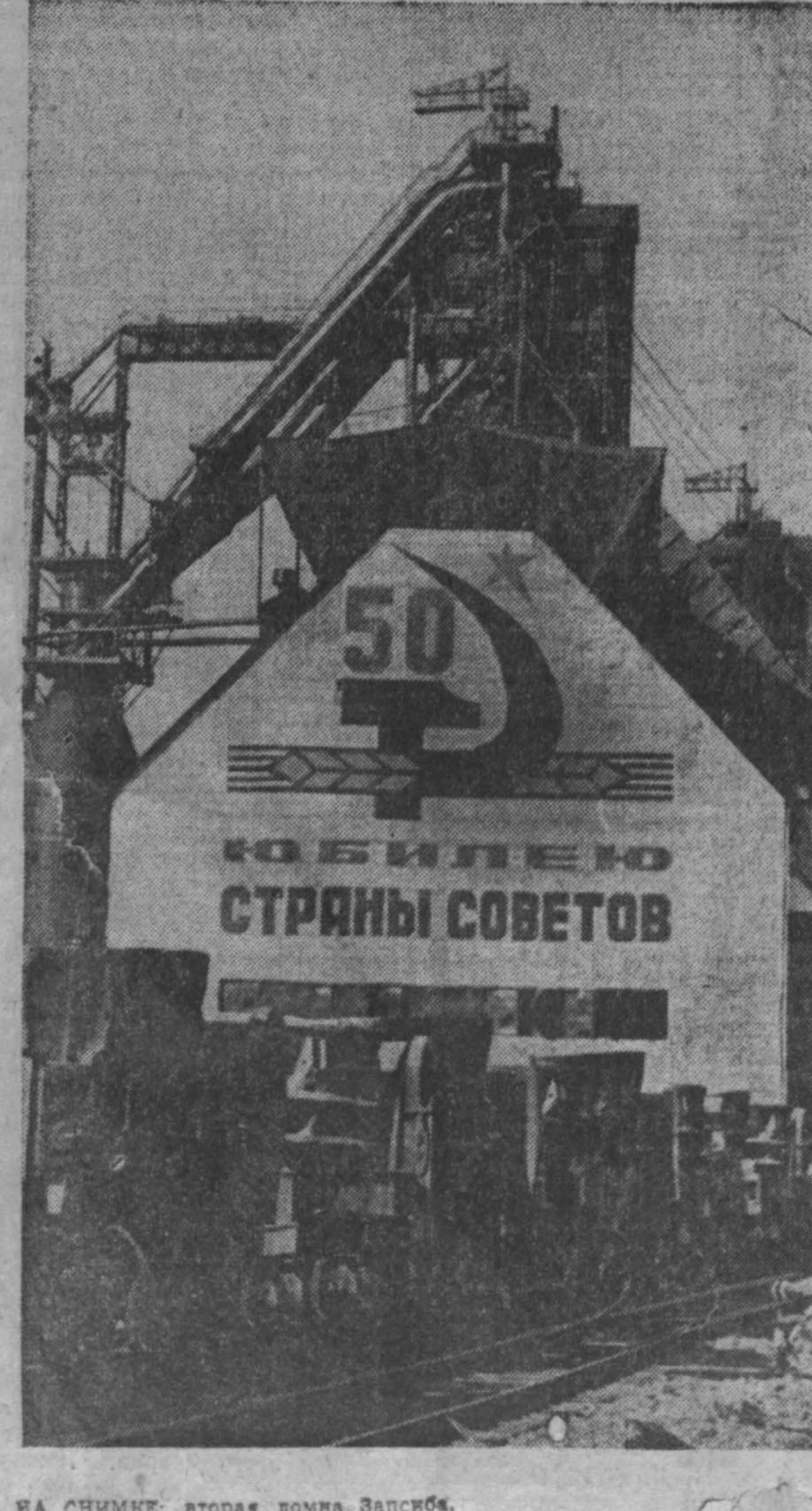
НА СНИМКЕ: вторая домна Запсиба.

Не вдруг расправил плечи сын, набрав силу. «Помню, вначале на бломинга за смену мы прокатали» (Окончание на 3-й стр.).