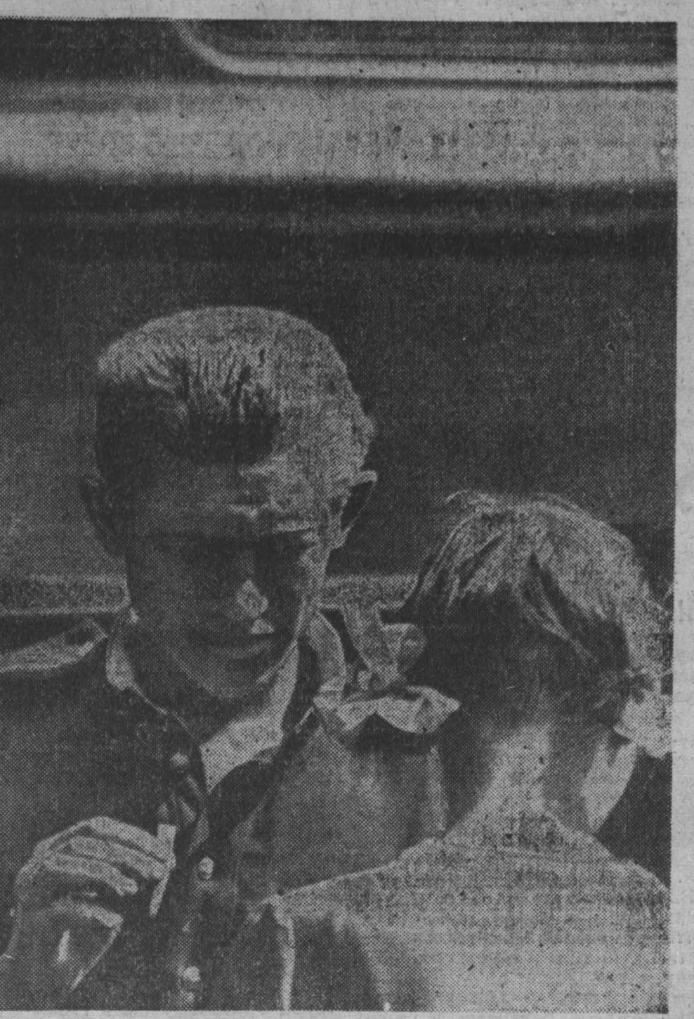
Объяснение Фотоэтид В. Кафо.

ГАВАНА. После шестнадцатого тура мемориала Капабланки по-прежнему лидирует В. Ларсен - 13 очков.