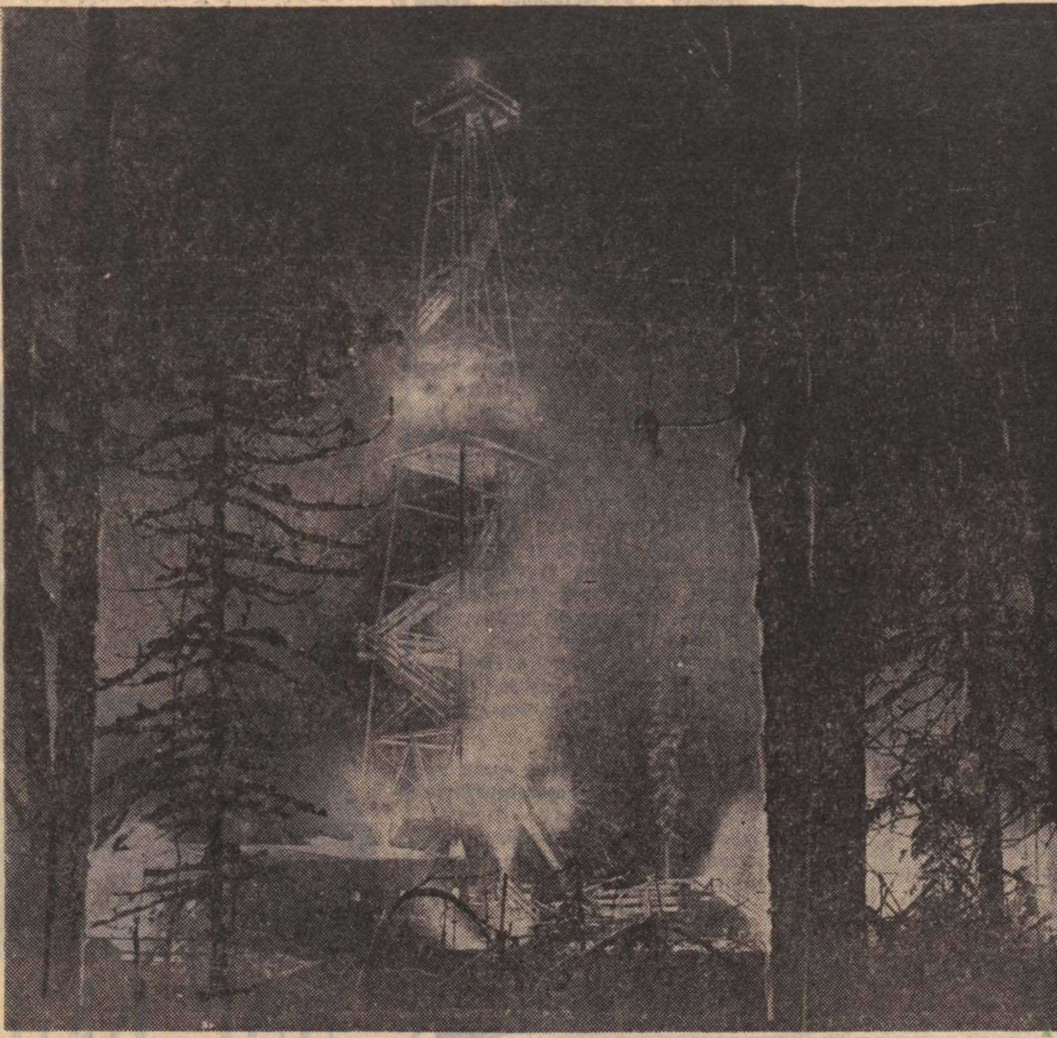
НЕДАВНО наши специальные корреспонденты К. Королев и Э. Эттингер побывали на севере Томской области. Они встречались с геобизиками, геологами и буровиками...