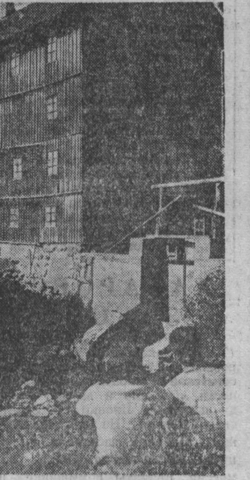
С. ЛАВРИНОВ, корр. ТАСС, Вильнюс.

На пойменных угодьях работает свыше 70 агрегатов, которые поставляют комбинированной промышленности десятки тысяч тонн богатого протеином и витаминами кормового сырья. А все земельные площади Приморья способны давать до четверти миллиона тонн ценного корма. Вот как хранят зерно комбайны.