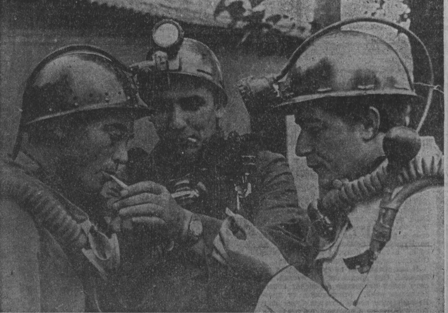
Эти люди не добывают уголь. Но на шахтах они уважаемы всеми. Бойцы горноспасательных отрядов всегда там, где шахтер попал в беду. НА СНИМКЕ: передовые бойцы 18-го ВГСО, отделения С. Мозгов только что вернулись из шахты.

в номере публикуются также обширная информация из местных партийных организаций, окончание очерка И. Коршунова «Где сходятся дороги (записки о районном зевне)», обзор печати и другие материалы».