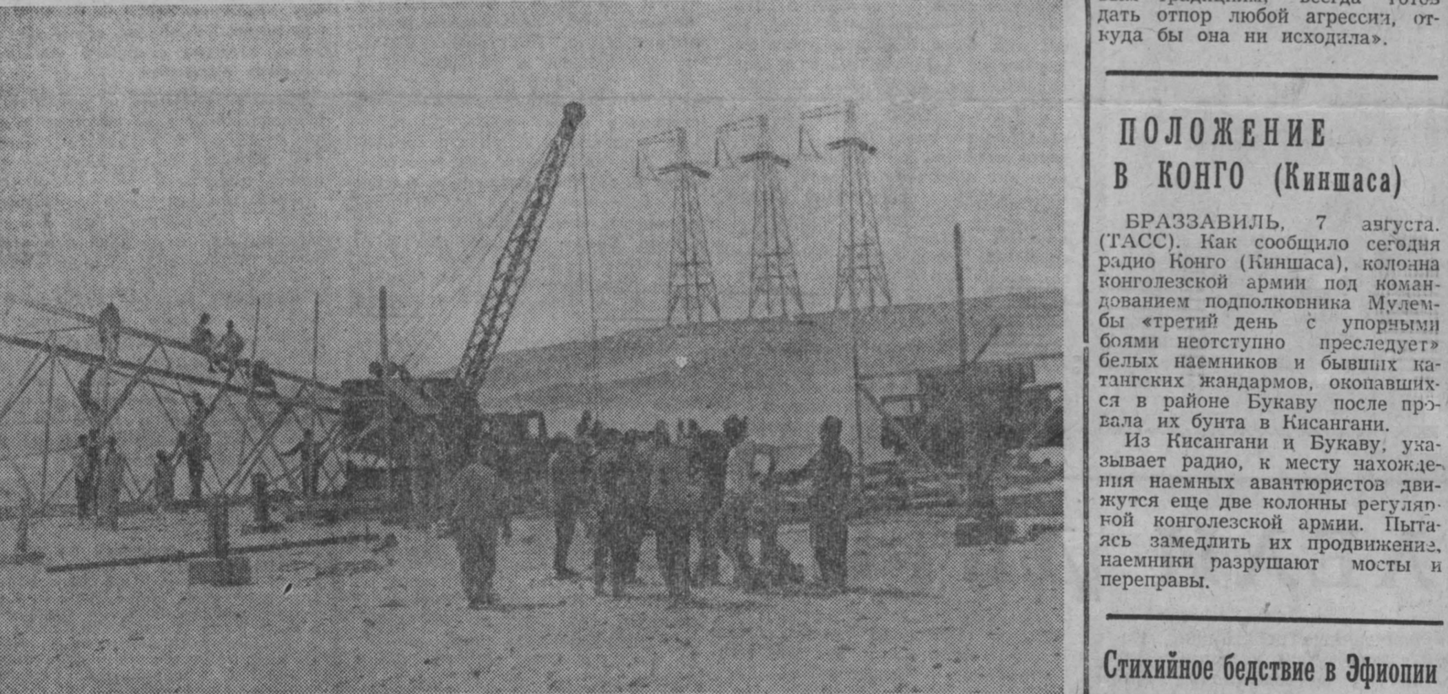
ОБЪЕДИНЕННАЯ АРАБСКАЯ РЕСПУБЛИКА. В конце этого года даст первый ток энергетический гигант Африканского континента — Сауд-аль-Аали в Асване. Советские специалисты помогают строить сооружение более чем тысячекилометровой линии электроснабжения Асуан-Александрия. Высоковольтная линия уже связала Асуанскую гидроэлектростанцию с Каиром. НА СНИМКЕ: завершается монтаж последних опор недалеко от Каира.