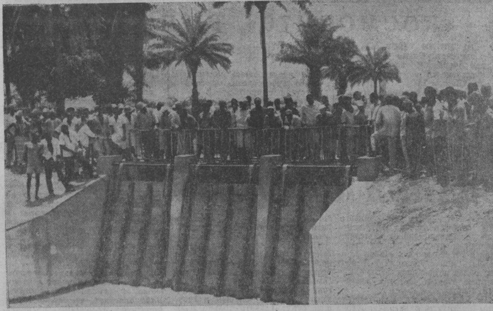
Советские специалисты оказывают населению Гвинеи значительную помощь в развитии сельского хозяйства. Построенная под их руководством ирригационная плотина в районе города Коба на побережье Атлантического океана обеспечит сброс избытка дождевой воды и предохранит поля от засоления во время сильных приливов. Это дает возможность не только расширить площадь рисовых полей на 500 гектаров, но и значительно повысить урожай этой важнейшей продовольственной культуры Гвинеи.

Итальянские газеты требуют наказать виновных и принять меры для недопущения впредь подобных актов произвола.