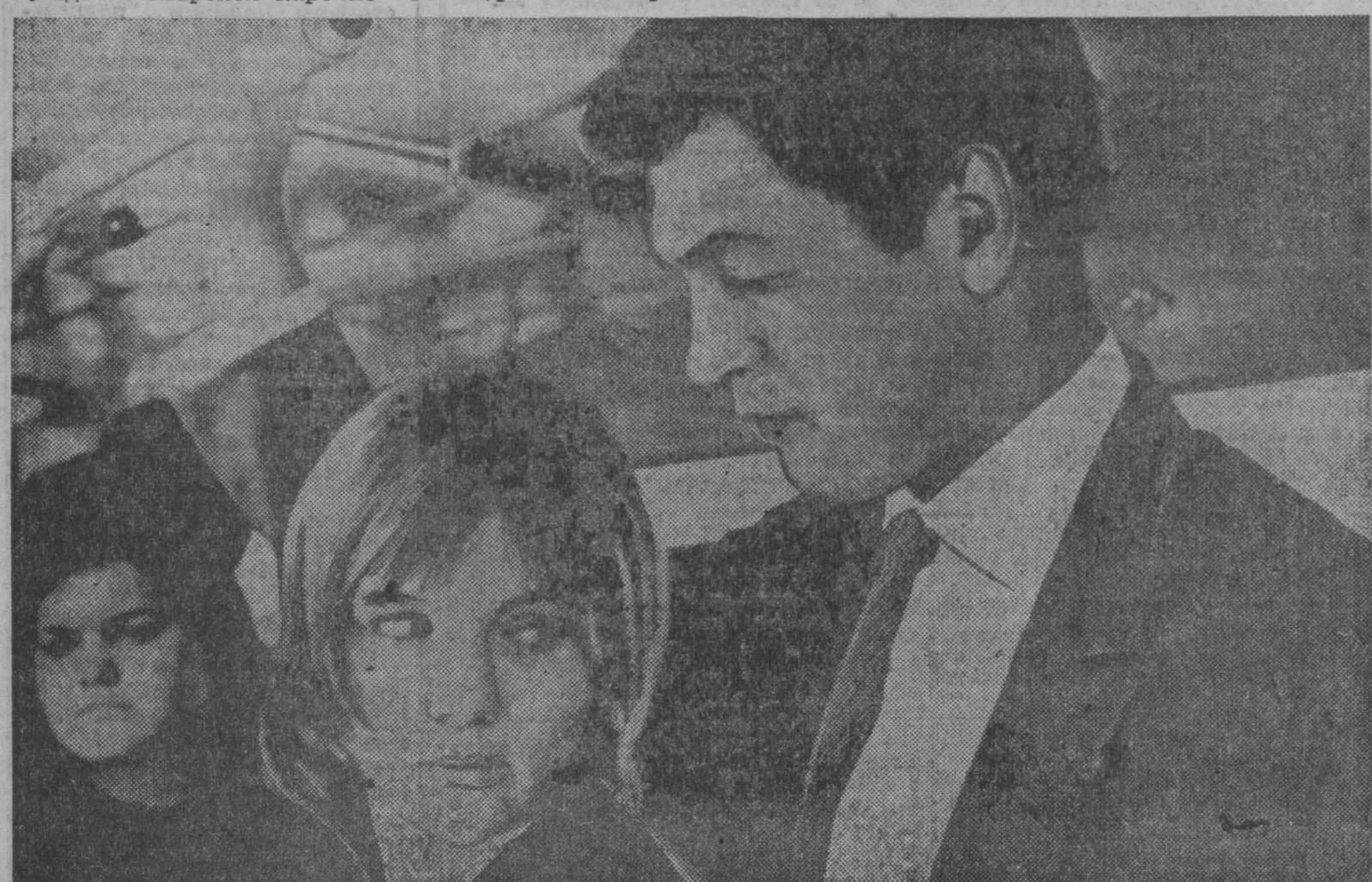
Кадр из фильма «Журналист».

30 июля в Ростове-на-Дону состоится 118-й основной тираж выигрышей по государственному 3-процентному внутреннему выигрышному займу, выпущенному в 1947 году В тираже по один разряд займа разыгрывается 8.500 выигрышей от 40 до 5.000 рублей на общую сумму 465.020 рублей. ПРИБРЕТАЙТЕ ОБЛИГАЦИИ СВОБОДНО ОБРАЩАЮЩИХСЯ ЗАЙМОВ