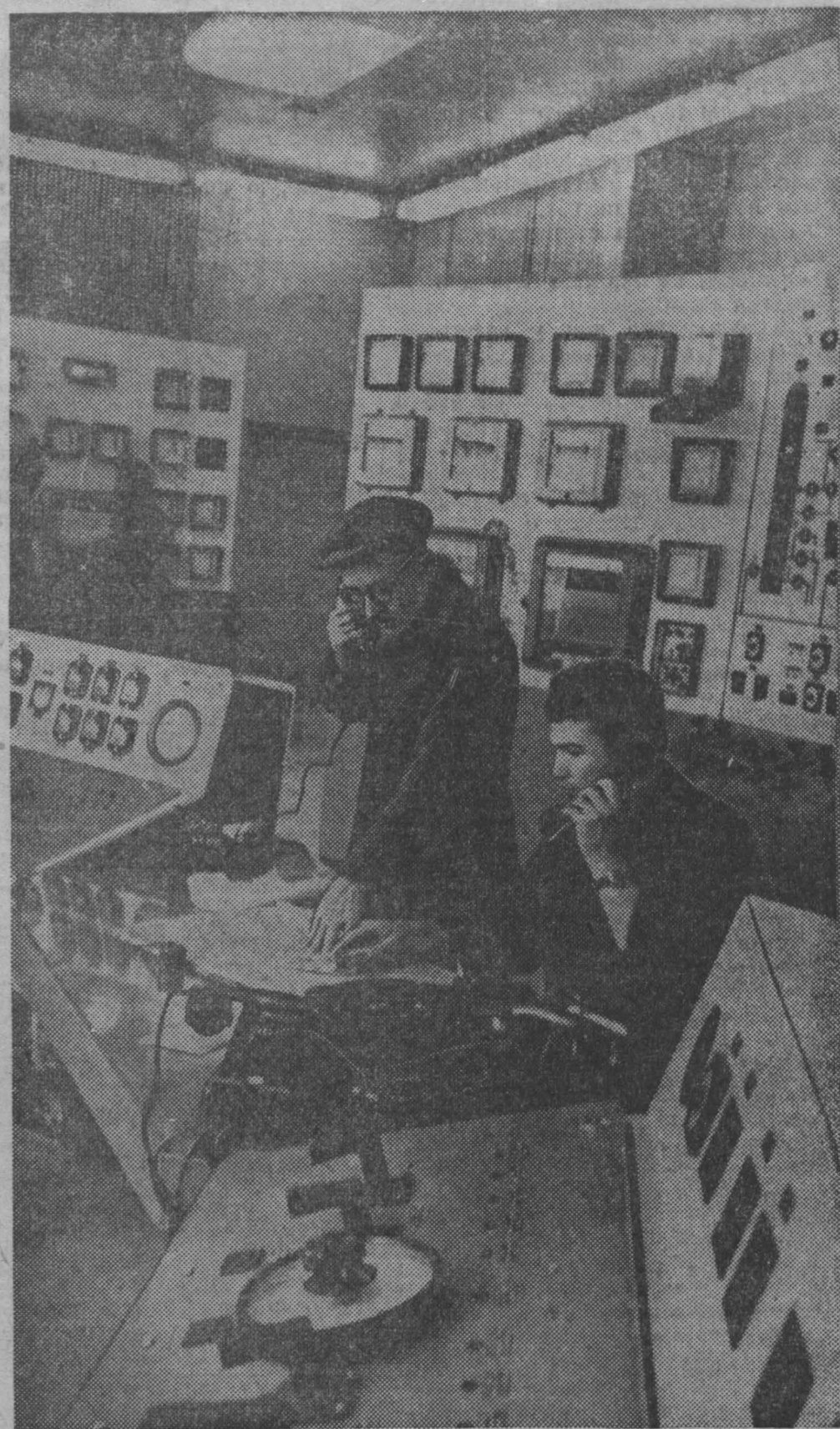
Вторая доменная Запсиба — самая крупная в Сибири. С вступлением ее в строй действующих производств чугуна на Западно-Сибирском металлургическом заводе увеличится больше чем в два раза.