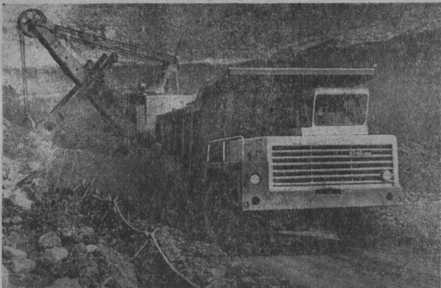
Кедровский угольный карьер — одно из крупнейших угольных предприятий Кузбасса. Ежедневно из забоев карьера вывозятся сотни тонн сверхпланового топлива.

20 ИЮЛЯ в Москву прибыл министр иностранных дел Японии Такэо Мики. В заявлении для печати Такэо Мики выразил уверенность, что развивающиеся в последние годы контакты между правительствами обеих стран будут в дальнейшем расширяться, содействуя углублению дружественных отношений между Японией и Советским Союзом, стабилизации международного обстановки на Дальнем Востоке, укреплению мира. Такэо Мики отметил, что имеется много областей, в которых обе страны могли бы сотрудничать на благо всего человечества. (ТАСС)