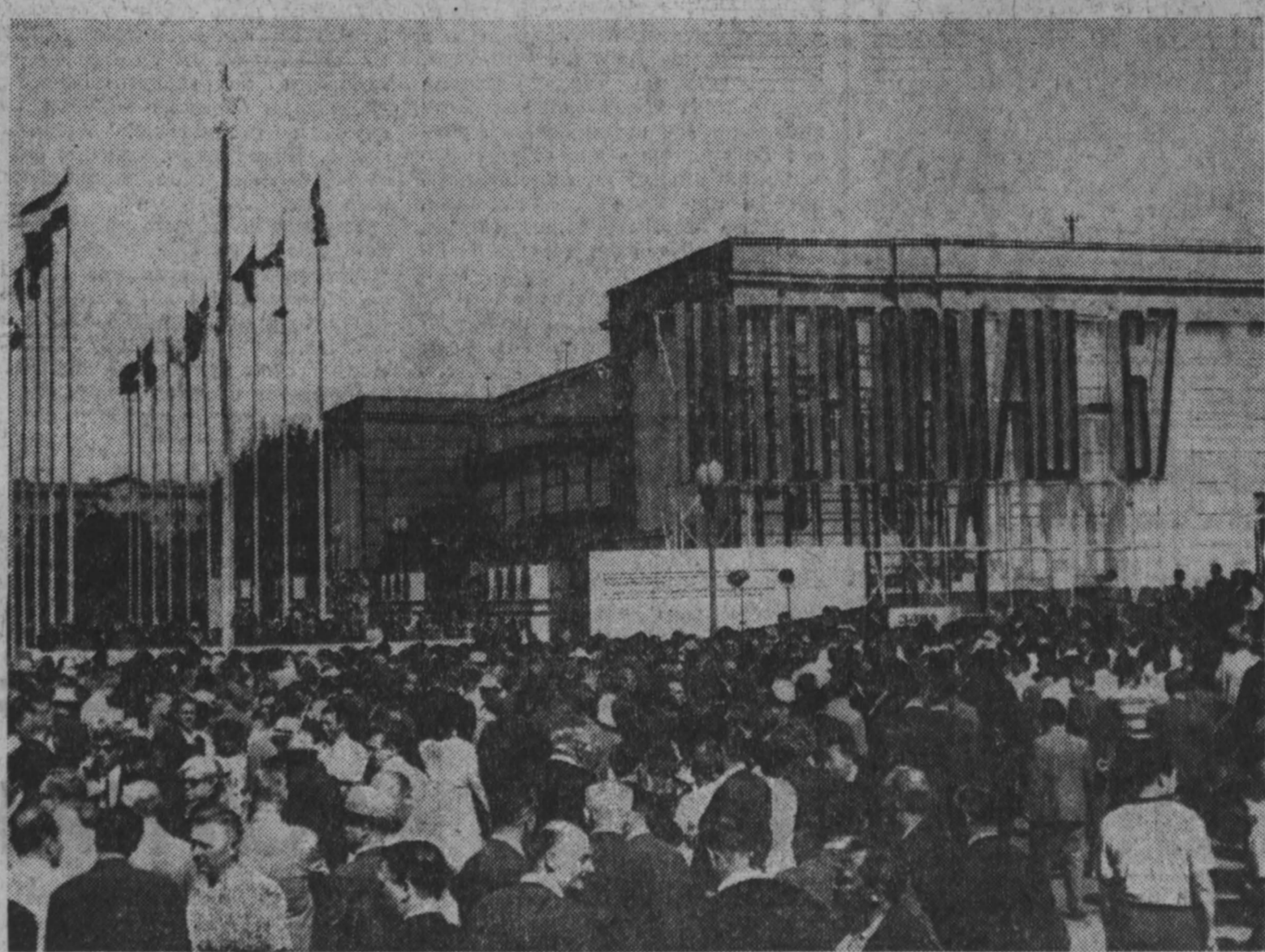
На выставке «Интергормаш-67» в Москве.