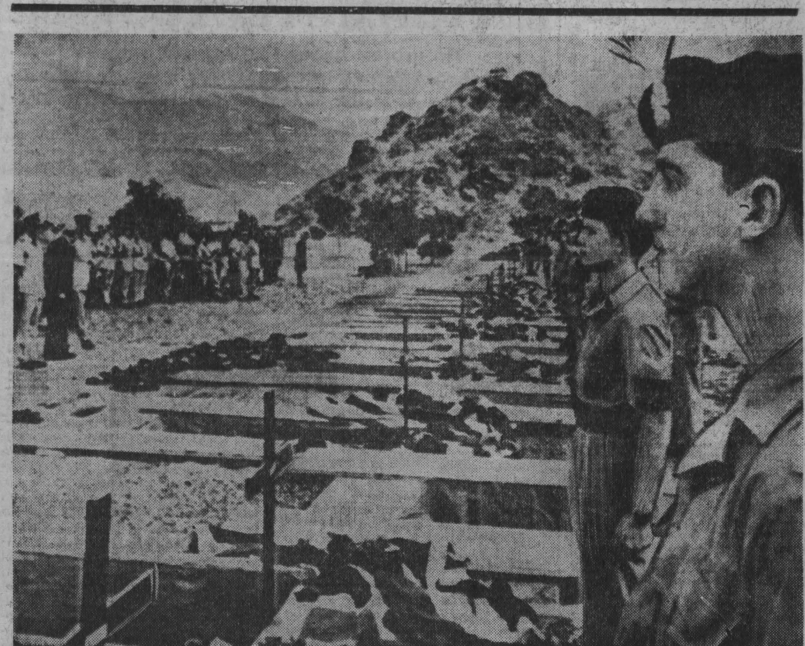
На снимке из лондонской газеты «Таймс» — солдаты оккупации оминых войск на военном пладнице близ Адена...

ЛОНДОН, 14 июля. (ТАСС). Небывалой силы снегопад обрушился на Карру — обширное нагорье, расположенное в северной части Южно-Африканской Республики.