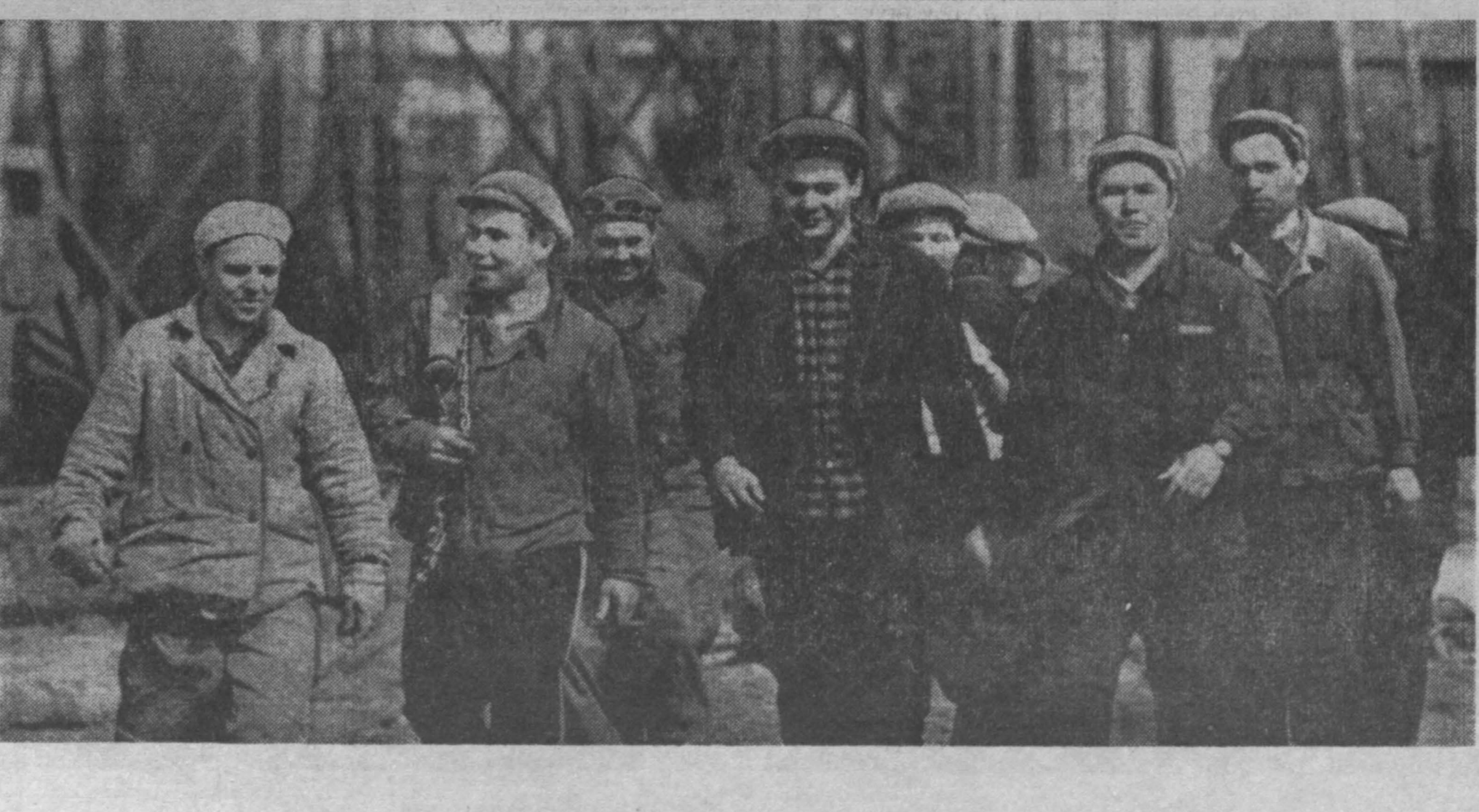
Фото В. Фозаева.

Председатель Президиума Верховного Совета РСФСР Секретарь М. ЯСНОВ, Верховного Совета РСФСР Х. НЕШКОВ, Москва, 28 июня 1967 г.